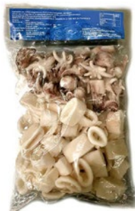
ANELLI/CIUFFI DI CALAMARO scottati congelati g 800