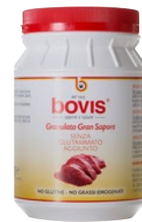
granulato carne senza glutammato aggiunto kg 1