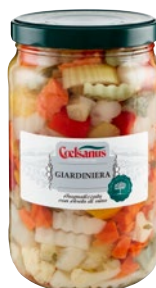
COELSANUS Giardiniera aromatizzata con aceto di vino kg 1,63