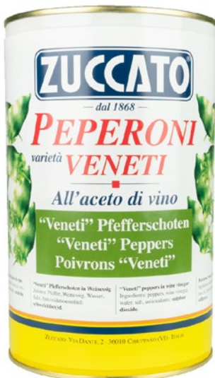
ZUCCATO peperoni veneti all'aceto di vino kg 3,9 sgocc kg 1,7