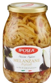
IPOSEA melanzane trifolate in olio di girasole g 950