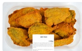
FILETTI DI PESCE AZZURRO PANATI al kg