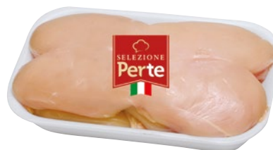
PER TE petto di pollo confezione risparmio al kg