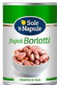
'O SOLE 'E NAPULE fagioli borlotti kg 2,5 sgocc kg 1,5