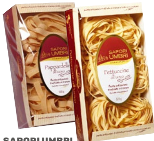
SAPORI UMBRI pasta all'uovo Pappardelle, Fettuccine g 500