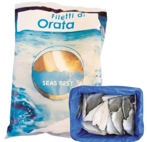
SEAS BEST filetto di orata con pelle 80/120 congelato g 750