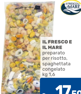
IL FRESCO IL MARE preparato per risotto, spaghettonata congelato kg 1,6