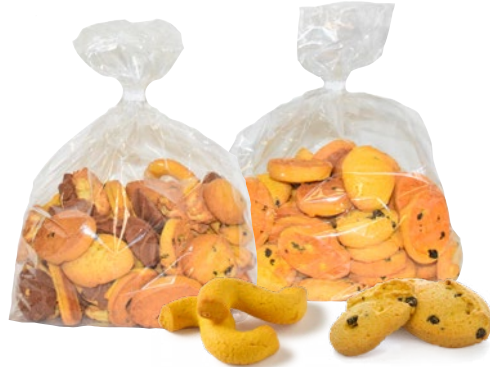
CARMELINA biscotti esse mignon, zaletti uvetta, assortiti kg 1