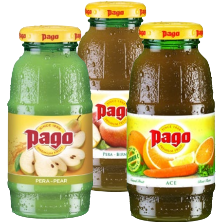
PAGO nettare, bevanda pera, pesca, albicocca, ace cl 20