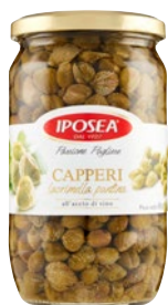
IPOSEA capperi lacrimella in aceto g 690 sgocc g 420