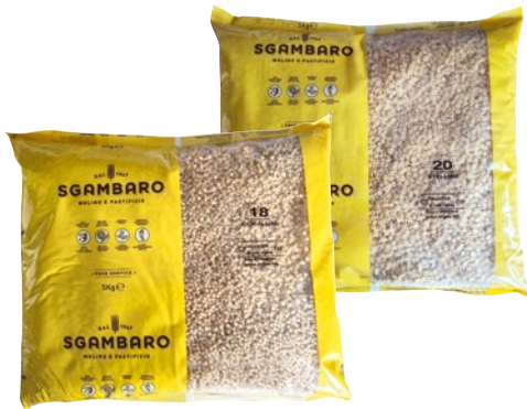
SGAMBARO pastina di semola assortita kg 5