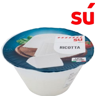
SÙ ricotta vaccina kg 1,5