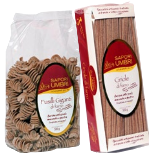
SAPORI UMBRI pasta al farro assortita g 500