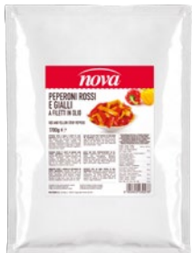
NOVA filetti di peperoni rossi/ gialli in olio kg 1,7