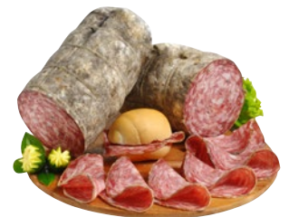
SALUMIFICIO VICENTINO sopressa Nostrana con, senza aglio al kg