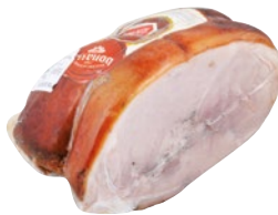
BONAZZA cosciotto di porchetta Trevigiana al kg