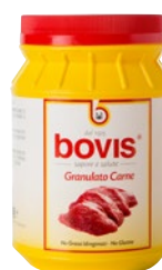
granulato carne kg 1