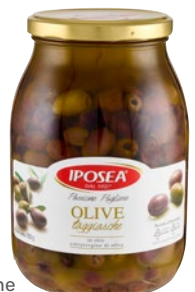
IPOSEA olive taggiasche in olio extravergine di oliva g 950