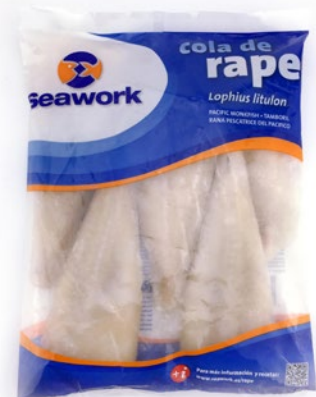
CODA DI RANA PESCATRICE 150/200 senza pelle congelato g 800