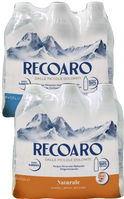
RECOARO acqua minerale naturale, frizzante bott 6 x cl 50