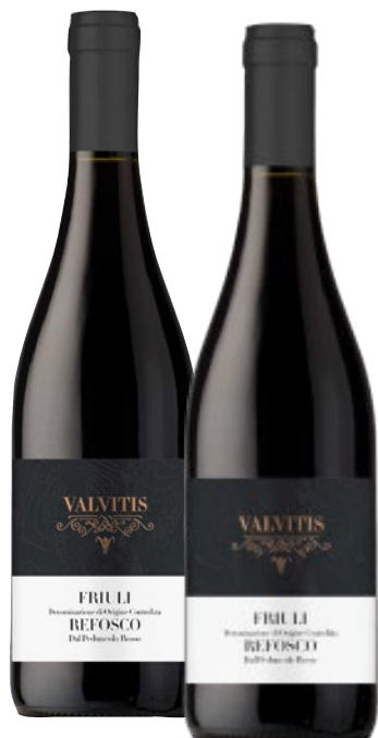
VALVITIS vini Friuli Grave DOP assortiti cl 75