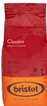
BRISTOT caffè Classico in grani kg 1