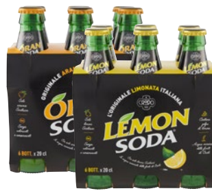
ORANSODA/ LEMONSODA bibite bott 6 x cl 20