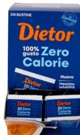
DIATOR edulcorante zero calorie 210 bustine g 168