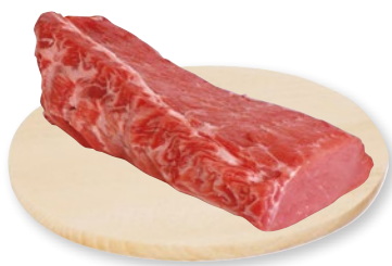
LONGA DI SUINO DISSOSSATA estera sottovuoto al kg