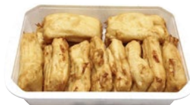
MOZZARELLA IN CARROZZA con acciuga kg 1,5 al kg