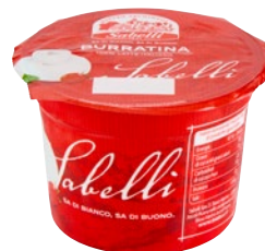
SABELLI Burratina g 125