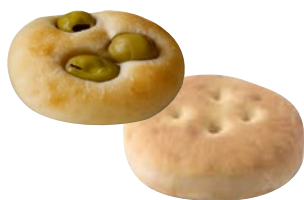
FOCACCINE olive, olio e sale prodotto cotto solo da decongelare al kg