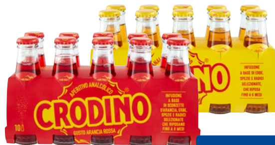
CRODINO Aperitivo analcolico biondo, rosso pz 10 x cl 10