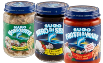
L'ISOLA D'ORO sughi di pesce assortiti g 130