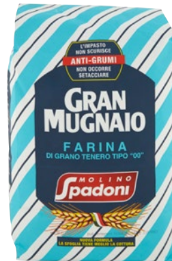
MOLINO SPADONI farina tipo "00" grano tenero Anti-Grumi kg 5