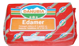
DANUBIA Edamer Tedesco 40% al kg