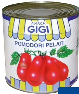
GIGI pomodori pelati kg 2,5