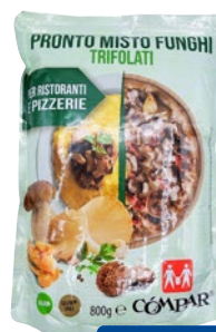
COMPAR misto funghi trifolati g 800