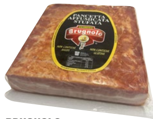
BRUGNOLO pancetta stufata affumicata al kg