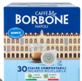
CAFFÈ BORBONE cialde compostabili Miscela Nobile pz 30 x g 7,2