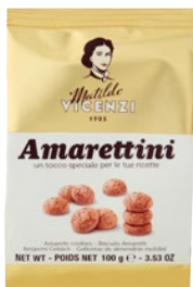
MATILDE VICENZI Amarettini g 100