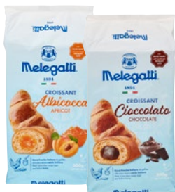
MELEGATTI croissant farciti assortiti pz 6 - g 300