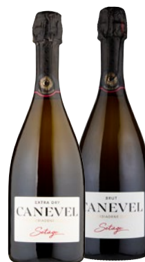
CANEVEL VALDOBBIADENE Prosecco superiore DOCG setàge brut, extra dry cl 75