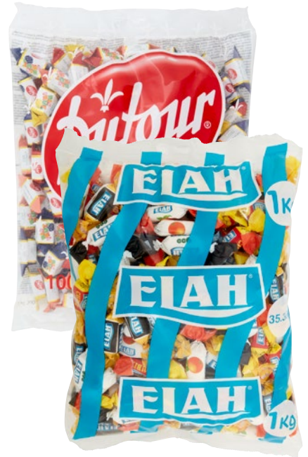
DUFOUR caramelle Bigfruit classiche, Elah assortite kg 1