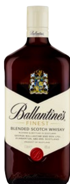
BALLANTINE'S Blended Scotch Whisky litri 1