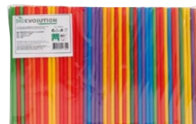
BIO EVOLUTION cannucce 21cm pz 500