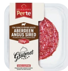
PER TE burger Aberdeen Angus bovino adulto senza glutine g 200