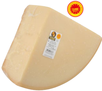
PARMIGIANO REGGIANO DOP 1/8 sottovuoto al kg