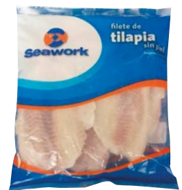
SEAWORK filetti di tilapia 140/200 senza pelle congelato g 800