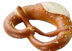
BREZEL prodotto cotto solo da decongelare al pezzo