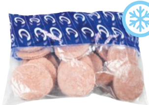
HAMBURGER BOVINO ADULTO senza glutine congelati pz 30 x g 100 kg 3