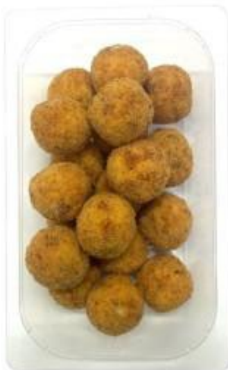
POLPETTE ALLA GRICA pz 20 al pezzo