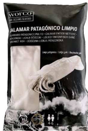
CALAMARO PATAGONICO pulito congelato g 900