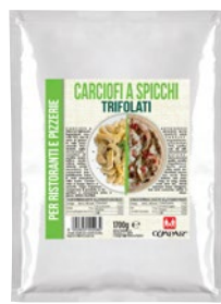
COMPAR carciofi spicchi alla Casalinga kg 1,7