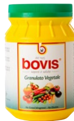
granulato vegetale kg 1