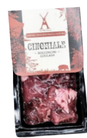
BOCCONCINI DI CINGHIALE congelato g 500