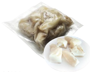
POLPA STOCCAFISSE reidratato sottovuoto congelato g 500