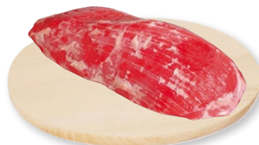
GIRELLO BOVINO ADULTO Irlanda sottovuoto al kg