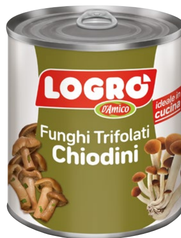
LOGRO' funghi Chiodini trifolati g 780 sgocc g 550