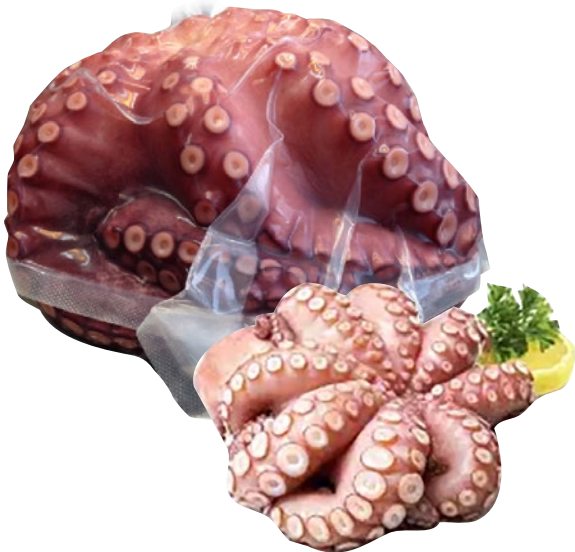
POLPO INTERO cotto sottovuoto 800/1200 ca congelato al kg