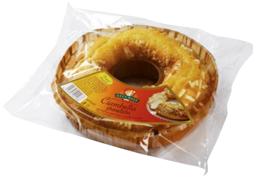
GECHELE ciambella granellata g 400