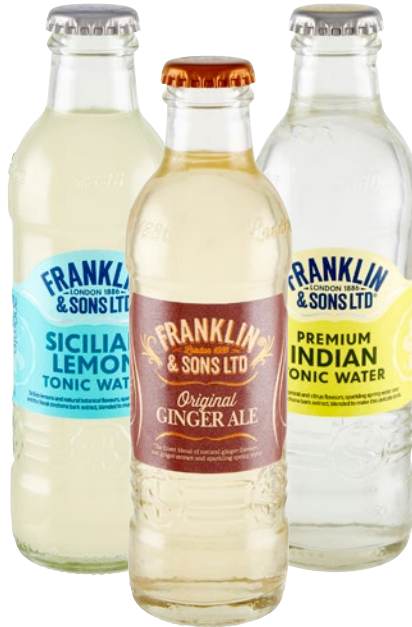
FRANKLIN & SONS ginger, acqua tonica assortita cl 20