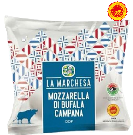
LA MARCHESA mozzarella di bufala Campana DOP g 250