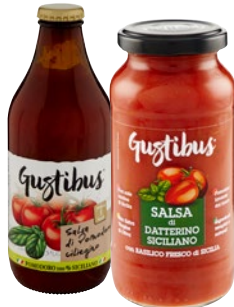
GUSTIBUS salsa di pomodoro ciliegino e datterino siciliano g 330/320