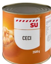
SÙ ceci kg 2,5 sgocc kg 1,5