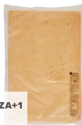
LA PIZZA+1 base bianca per pizza fresca pz 2 - kg 2,2 al pezzo