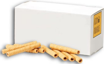
GECHELE cannoli gelato corti pz 250 - g 900