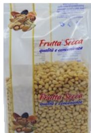
MURANO pinoli siberiani g 500