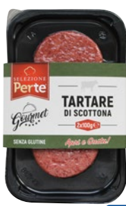
PER TE tartare di Scottona bovino adulto g 200