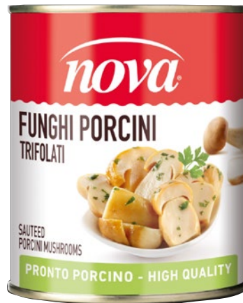
NOVA funghi Porcini trifolati g 780