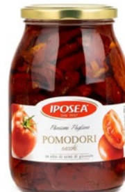
IPOSEA pomodori secchi in olio di girasole g 900