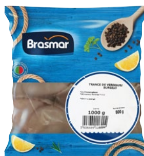
TRANCE DI VERDESCA 80/150 congelate g 800