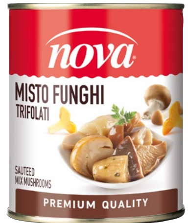
NOVA misto funghi trifolati g 780