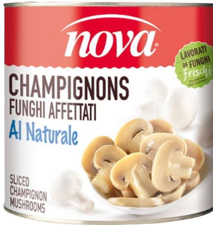
NOVA funghi Champignon al naturale kg 2,65 sgocc kg 1,2