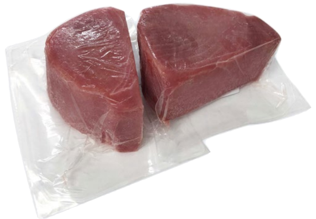
FILONE TONNO PINNEGIALLE 800/1200SV congelato al kg