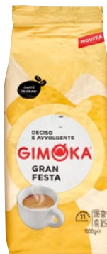
GIMOKA caffè Gran Festa in grani kg 1