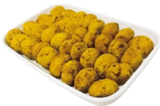
POLPETTE DI VERDURE kg 1,5 al kg