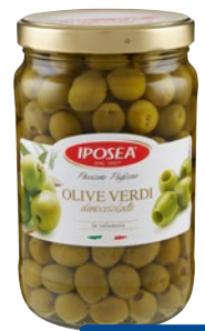
IPOSEA olive verdi denocciolate kg 1,6 sgocc g 800