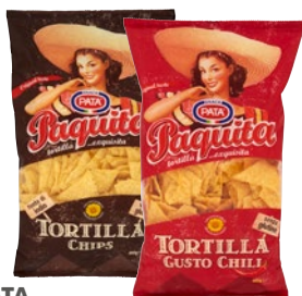
PATA PAQUITA tortilla chips, chili g 400