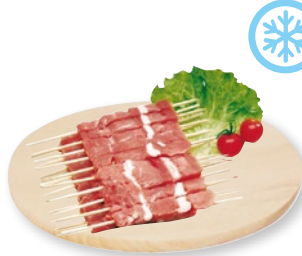
ARROSTICINI OVINO ADULTO congelati kg 1