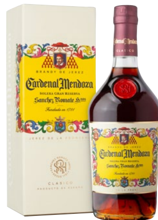
CARDINAL MENDOZA Brandy de Jerez cl 70