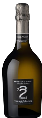
TERRE NARDIN Prosecco DOC millesimato cl 75