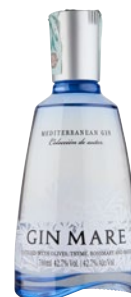
GIN MARE Mediterranean Gin cl 70