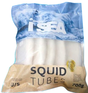
TUBI TOTANO Atlantico puliti u5 congelato g 700