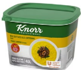
KNORR Mise en Place allo zafferano g 800