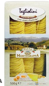
MONTEGRAPPA pasta all'uovo tagliatelle, fettuccine, tagliolini g 500