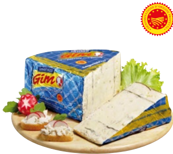
INVERNIZZI Gim Gorgonzola DOP al kg