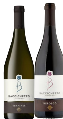
BACCICHETTO VITTORINO vini delle Venezie Cabernet DOC, Refosco IGT, Traminer IGT cl 75