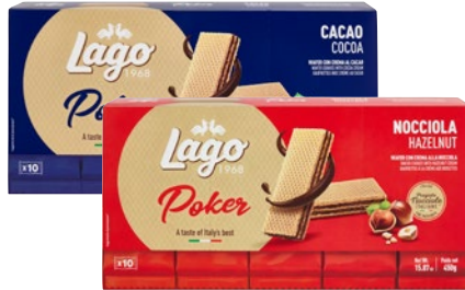
LAGO wafer Poker cacao, nocciola pz 10 - g 450