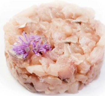
TARTARE DI RICCIOLA top quality congelato pz 4 x g 80