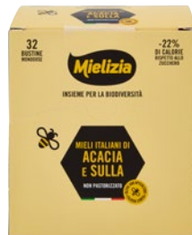
MIELIZIA mieli Italiani acacia e sulla non pastorizzato bustine 32 x g 5