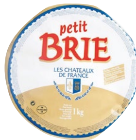
CHATEAUX DE FRANCE Petit Brie kg 1