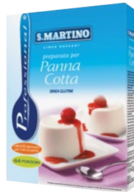
SAN MARTINO preparato per panna cotta kg 1,04