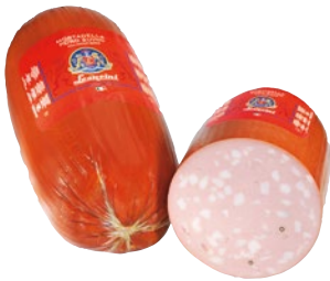
LEONCINI mortadella con, senza pistacchi al kg