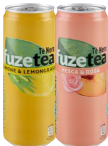
FUZE TEA Tè limone, pesca cl 33