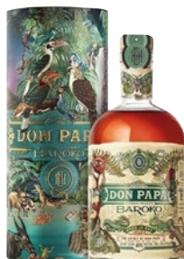
DON PAPA Ron Baroko cl 70