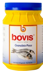
granulato pesce kg 1