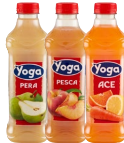
YOGA bevande assortite litri 1