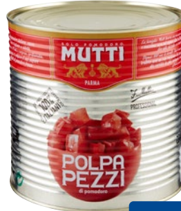
MUTTI polpa pomodoro a pezzi kg 2,5