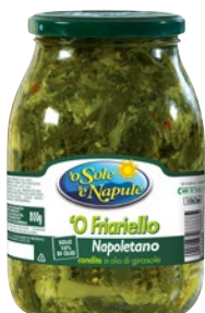
'O SOLE' NAPULE friariello Napoleitano g 960