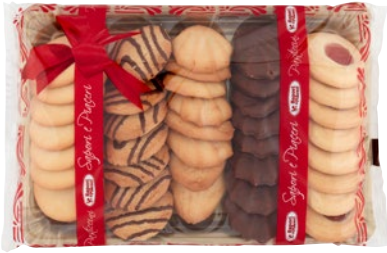
SAPORI E PIACERI pasticceria da the g 400