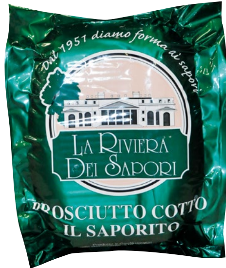
BRUGNOLO prosciutto cotto Il Saporito al kg