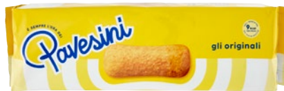
PAVESI Pavesini Originali pz 8 - g 200