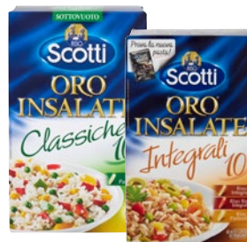
RISO SCOTTI Oro Insalate 10' classiche, integrali, venire kg 1/g 850/800