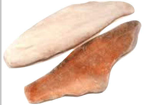
FILETTO DI SCORFANO Atlantico con pelle 200/300 surgelato kg 1