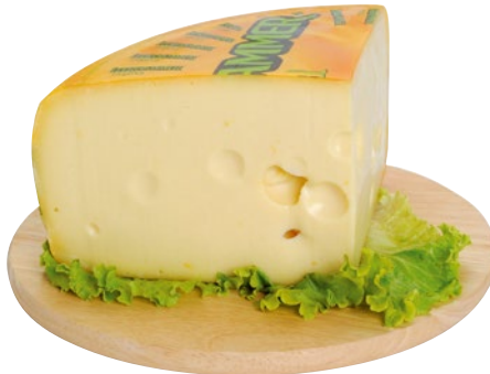
LEERDAMMER formaggio 1/4 al kg