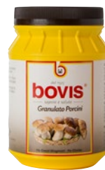
granulato porcini kg 1