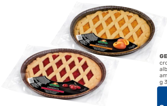
GECHELE crostata albicocca, amarena g 350