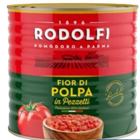
RODOLFI ALPINO polpa di pomodoro kg 2,5