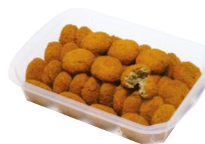
POLPETTE ALLA CARNE kg 1,5 al kg