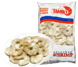
MAZZANCOLLE S/GUSCIO devenate Ecuador 41/50 congelate g 750