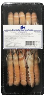
SCAMPO INTERO 8/12 Irlanda congelato g 750