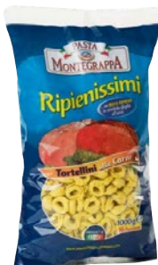
MONTEGRAPPA tortellini alla carne kg 1