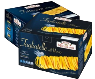
MONTEGRAPPA pasta all'uovo fettuccine, tagliatelle kg 2