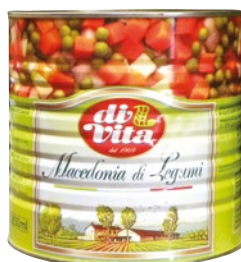
DI VITA macedonia legumi kg 2,6 sgocc kg 1,66