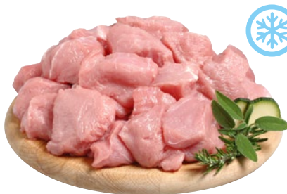
SPEZZATINO DI TACCHINO sottovuoto congelato al kg