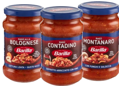
BARILLA ragù, sugo assortiti g 300