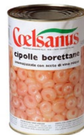
COELSANUS cipolle borettane in aceto di vino rosso kg 4 sgocc kg 2,6