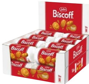
LOTUS biscotti biscoff cream pz 16 - g 800