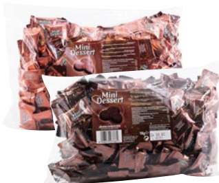
ICAM ciocco mini dessert latte, fondente kg 1