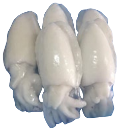
SEPIE PULITE Marocco 1000/2000 CA IWP surgelato al kg