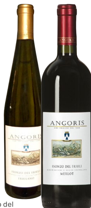
ANGORIS vini Isonzo del Friuli DOC Pinot grigio, Sauvignon, Friuliano, Merlot cl 75