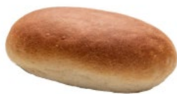
PIUMETTE AL LATTE prodotto cotto solo da decongelare al kg