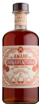
DISTILLERIA BONAVENTURA Amaro Erbe e Spezie cl 70