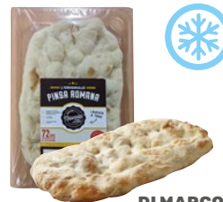
DI MARCO base Pinsa Romana precotta cm 19x30 surgelata pz 16 kg 3,68