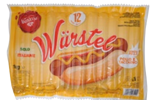
BONAZZA wurstel pollo e tacchino pz 12 - kg 1