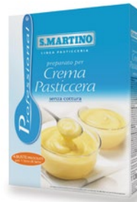
SAN MARTINO preparato per crema pasticcera kg 1,12