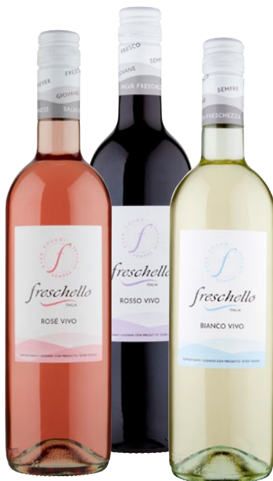
FRESCHELLO vino vivo Rosso, Bianco, Rosè cl 75