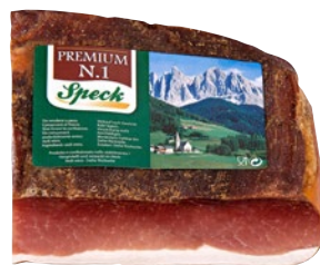
MOSER speck Premium 1/4 al kg