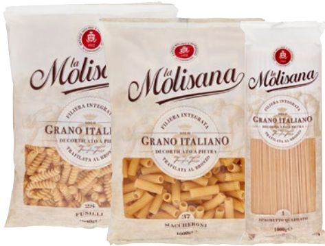
LA MOLISANA pasta di semola assortita kg 1