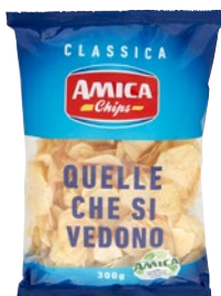
AMICA CHIPS patatine classiche g 300