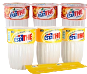
ESTATHÈ Thè limone, pesca pz 3 x cl 20