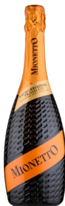
MIONETTO Valdobbiadene Prosecco superiore extra dry DOCG cl 75