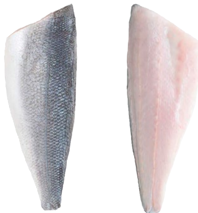
FILETTO DI SPIGOLA Pacifico con pelle 120/160 congelato kg 5