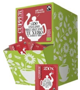
CUPPER te nero english break fast filtri 250 - g 995