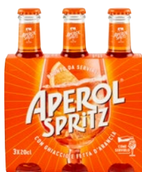
APEROL Spritz pz 3 x cl 20