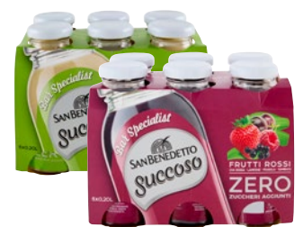
SAN BENEDETTO Succoso Zero Bar Specialist assortiti bott 6 x cl 20