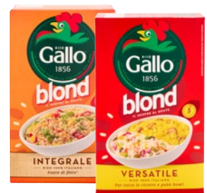
GALLO BLOND riso Integrale, Versatile kg 1