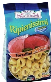
MONTEGRAPPA tortellini alla carne g 250