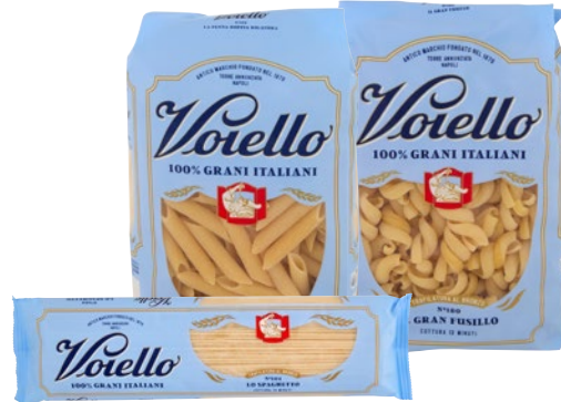
VOIELLO pasta trafilata bronzo assortita g 500