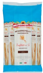
PANCALBA grissini ristorante Sfarinatelli pz 12 - g 240