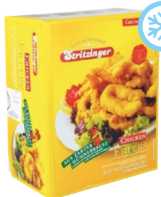
CHICKEN FRITES PANATI congelati kg 1