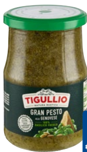
TIGULLIO gran pesto alla Genovese g 500