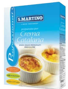
SAN MARTINO preparato per crema catalana g 800