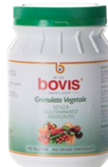
granulato vegetale senza glutammato aggiunto kg 1