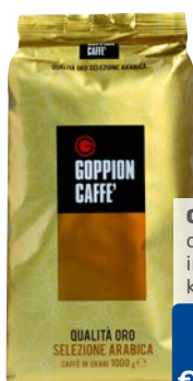
GOPPION caffè Qualità Oro in grani kg 1