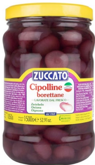
ZUCCATO cipolline Borettane in aceto kg 1,5 sgocc kg 1,05