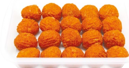
ARANCINI DI RISO kg 1 al kg