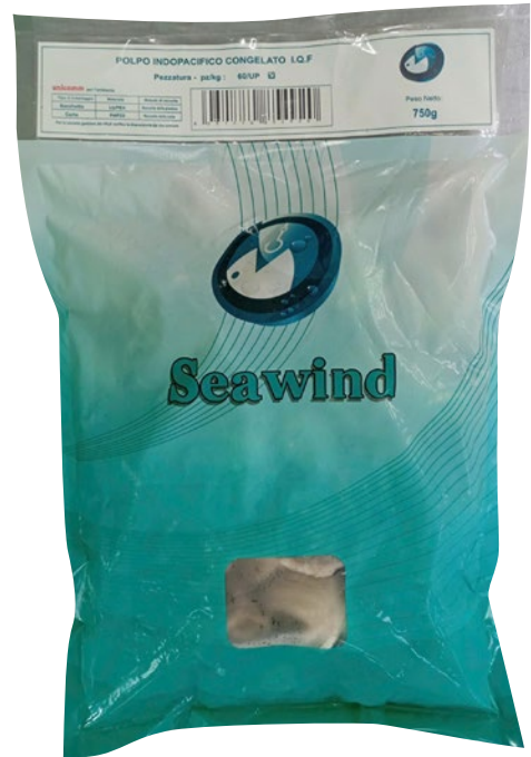
POLPO INDOPACIFICO pulito 60 UP IQF congelato g 750