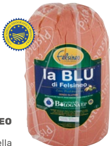
FELSINEO la Blu mortadella Bologna IGP con, senza pistacchi al kg