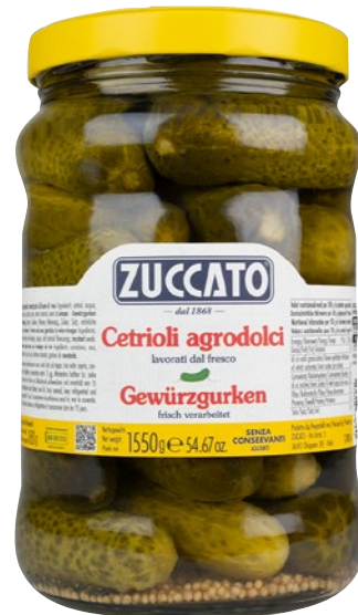
ZUCCATO cetrioli agrodolci kg 1,55 sgocc g 880