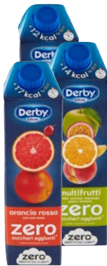
DERBY blue zero bevanda ace, arancia rossa, multifrutti litri 1