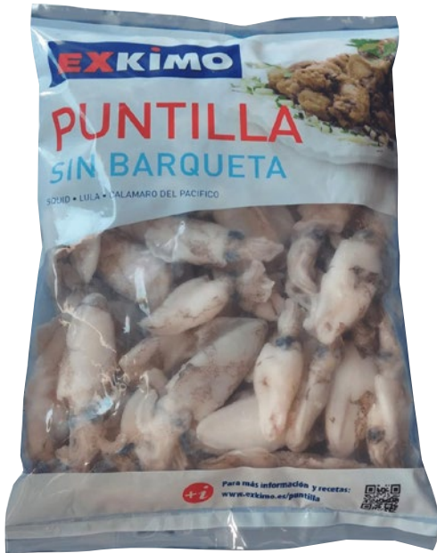
CALAMARI PUNTILLA 4/6cm senza pluma congelato g 800