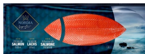
FILETTO SALMONE NORVEGese 1,0-1,4 kg sottovuoto trim D congelato al kg