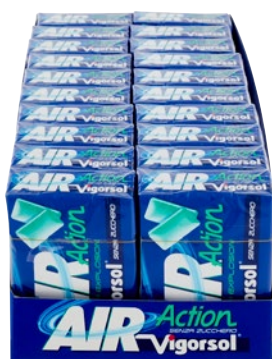
VIGORSOL chewing gum Air Action pz 20 x g 29