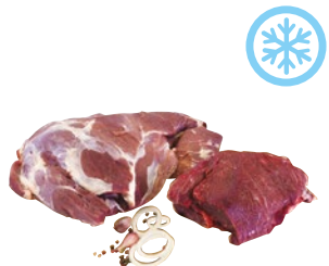
POLPA EXTRA cinghiale congelata kg 2,5