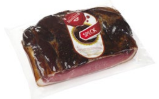
BONAZZA speck squadrato 1/2 al kg