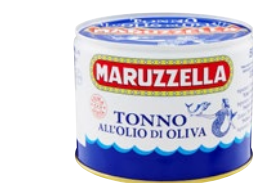
MARUZZELLA tonno all'olio di oliva g 500