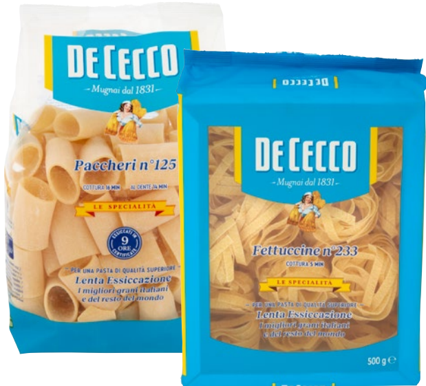
DE CECCO Le Specialità pasta di semola Paccheri, Fettuccine g 500