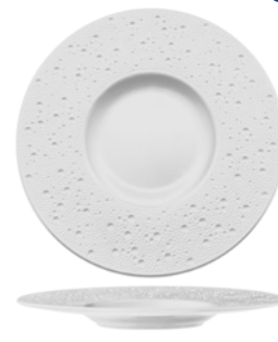
PIATTO GOURMET GURAL - LINEA MOON