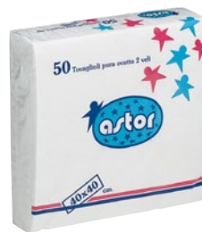
ASTOR tov.li 2v. 40x40 bianchi pz 50