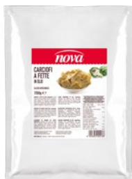
NOVA carciofi a fette in olio kg 1,7