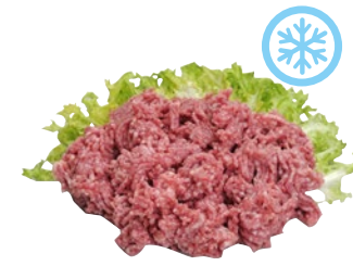
MACINATO DI ANATRA congelato al kg