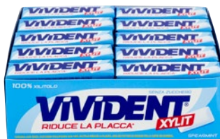
VIVIDENT XYLIT chewing gum stick Spearmint pz 40 x g 13,5