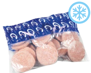
HAMBURGER BOVINO ADULTO senza glutine congelati pz 30 x g 100