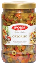
IPOSEA ortoriso kg 1,6