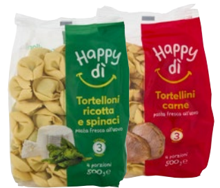
HAPPY DI pasta fresca ripiena assortita g 500