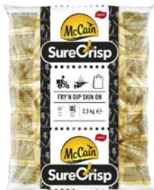
MCCAIN patate Sure Crisp surgelate kg 2,5