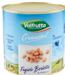
VALFRUTTA GRANCHEF fagioli borlotti da fresco kg 3 sgocc kg 2,6