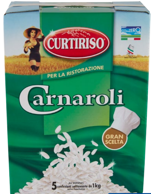
CURTIRISO riso Carnaroli kg 5