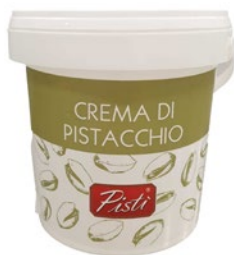
PISTI' crema spalmabile al pistacchio kg 1