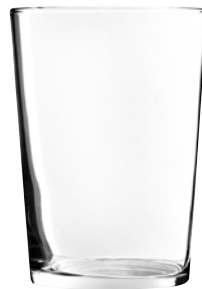
BICCHIERE BISTROBAR pz 12 - cad