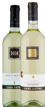
CASA DEFRA Vini Colli Berici, DOC Pinot Bianco, Sauvignon cl 75