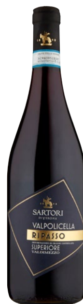
SARTORI Valpolicella Ripasso Superiore DOC Valdimezzo cl 75