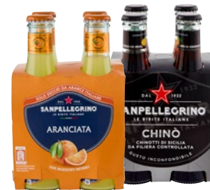
SAN PELLEGRINO bibite assortite bott 4 x cl 20