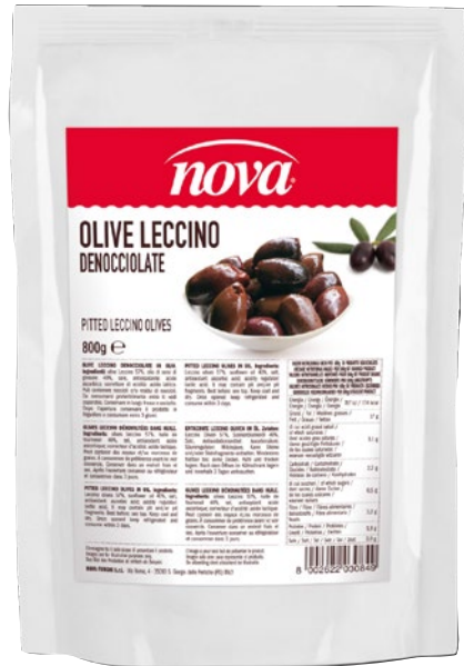
NOVA olive Leccino denocciolate g 800