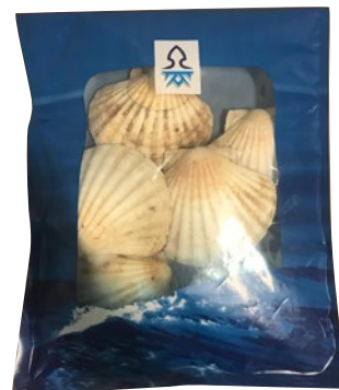
CAPPASANTA ATLANTICA intera c/corallo 5/7 congelato kg 1