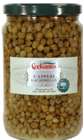
COELSANUS capperi lacrimella in aceto di vino kg 1,7 sgocc kg 1