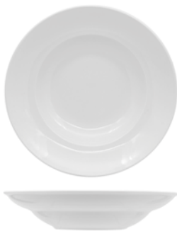
PIATTO STYLE PORCELLANA BIANCO PASTA BOWL cm 27