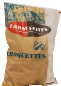
FARM FRITES croquettes surgelate kg 2,5