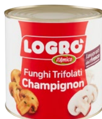
LOGRÒ funghi Champignon trifolati kg 2,4