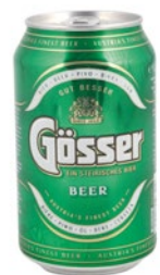
GOSSER birra chiara cl 33