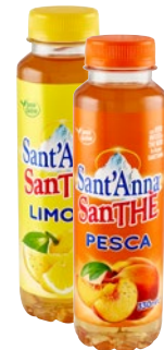
SANT'ANNA SanThè limone, pesca cl 33