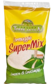
CASCINA TORRE ANTICA formaggio grattugiato Supermix kg 1