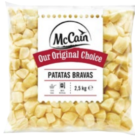
MCCAIN patate Bravas surgelate kg 2,5