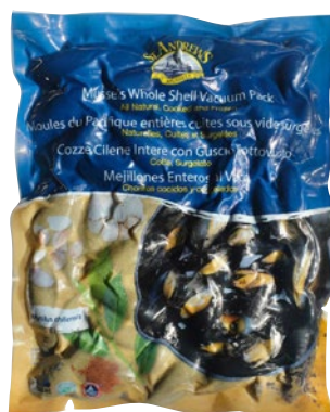
COZZE CON GUSCIO cotte Chile 50/70 congelate kg 1