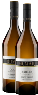
HUMAR vini bianchi DOC assortiti cl 75