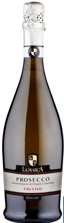
LA MARCA Prosecco Treviso DOC extra dry cl 75