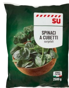
SÙ spinaci a cubetti surgelati kg 2,5