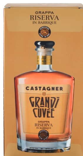
CASTAGNER Grappa Riserva in barrique cl 50