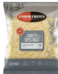
FARM FRITES patate crispy coated surgelate kg 2,5