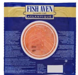
FISH AVEN salmone Atlantico affumicato g 200