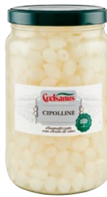
COELSANUS cipolline aromatizzate con aceto di vino kg 1,63 sgocc kg 1