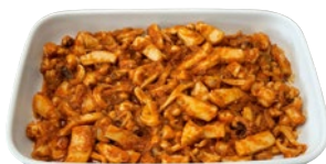
SEPPIE IN UMIDO kg 1,2 al kg