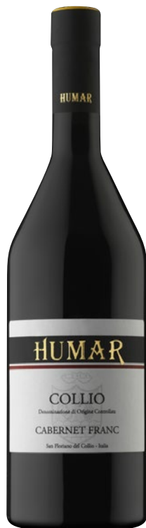
HUMAR Cabernet Franc Collio DOC cl 75