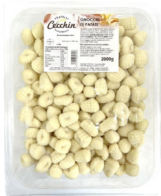
CECCHIN gnocchi di patate freschi kg 2