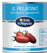
'O SOLE 'E NAPULE Il Pelatino dolcissimo kg 2,5 sgocc kg 1,5