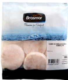
CUORICINI DI MERLUZZO Atlantico surgelato g 700