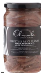
OLIOSALE filetti di alici del Mar Cantabrico in olio di girasole g 720