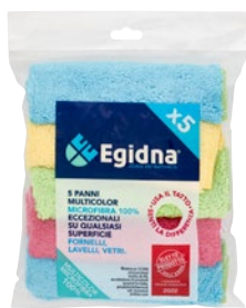
EGIDNA panni microfibra colorati cm 20X30 - pz 5