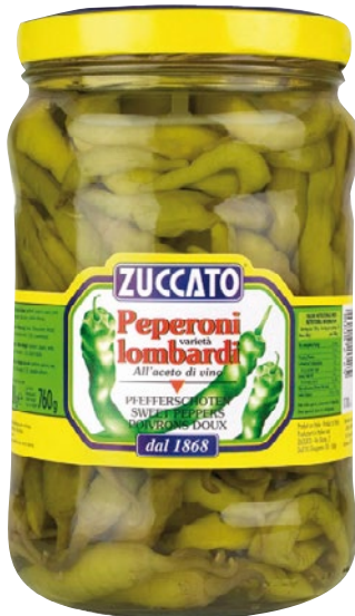
ZUCCATO peperoni Lombardi all'aceto di vino kg 1,5 sgocc g 760