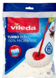
VILEDATA ricambio mop turbo refill 100% microfibre pz 1