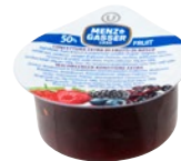
MENZ & GASSER confettura extra di frutti di bosco pz 100 x g 25