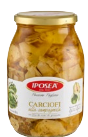
IPOSEA carciofi alla campagnola in olio di semi di girasole g 950