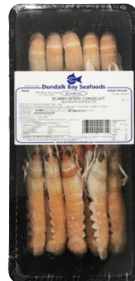
SCAMPO INTERO Irlanda pz 17/20 congelato g 750