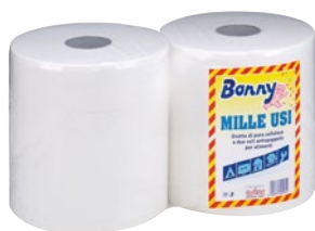
ASTOR Bonny bobina multiuso goffrata 2 veli pz 2