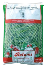
BELAMI fagiolini fini surgelati kg 2,5