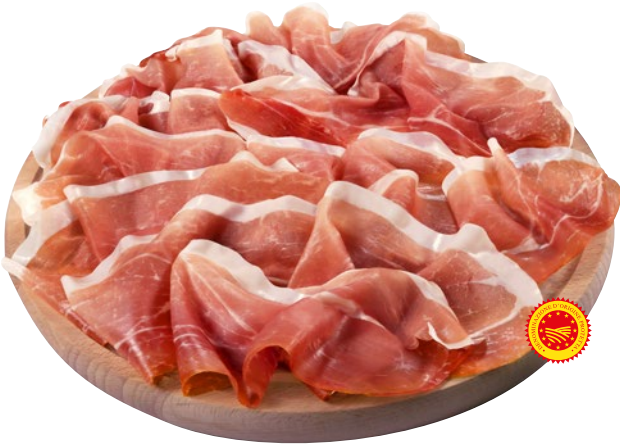
ALCARUNO prosciutto crudo stagionato al kg