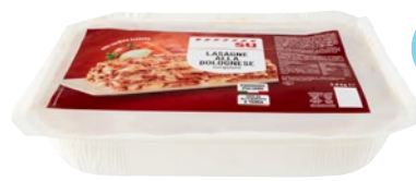
SÙ lasagne alla Bolognese surgelate kg 2,5