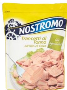
NOSTROMO trancetti di tonno all'olio di oliva kg 1