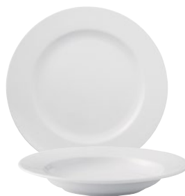
PIATTI PORCELLANA GURAL - LINEA DELTA