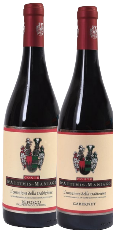
CONTE D'ATTIMIS vini FCO DOC Refosco, Cabernet cl 75