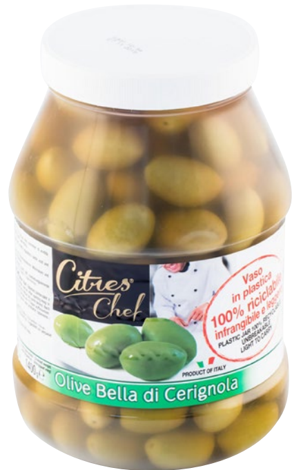
CITRES olive verdi Bella di Cerignola in salamoia kg 2,3 sgocc kg 1,4