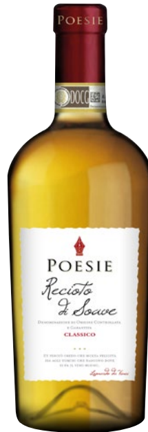
LE POESIE Recioto di Soave classico DOCG cl 50