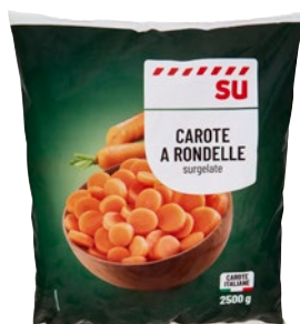
SÙ carote a rondelle surgelate kg 2,5