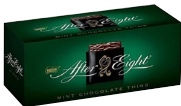
AFTER EIGHT cioccolatini ripieni alla menta Fresh Blast pz 200