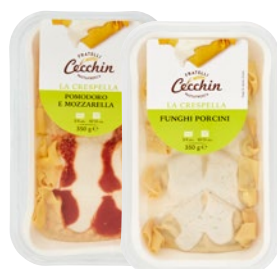
CECCHIN La Crespella ripieno assortito g 350