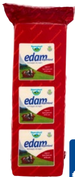
BAYERNLAND formaggio Edam 40% al kg