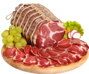
M. BRUGNOLO coppa stagionata g 800 ca al kg