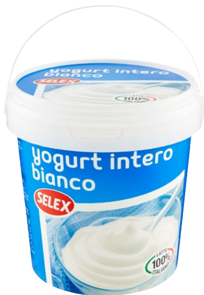
SELEX yogurt intero bianco kg 1