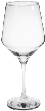
CALICE IVORY pz 6 - cad