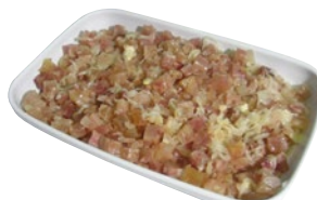
NERVETTI CON CIPOLLA kg 2 al kg