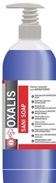
OXALIS SANI SOAP sapone lavamani igienizzante litri 1