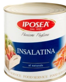
IPOSEA insalatina al naturale kg 2,45 sgocc kg 1,2