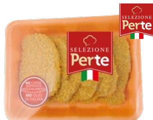
PERTE cotoletta di pollo e spinaci senza olio di palma g 500