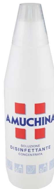
AMUCHINA soluzione disinfettante concentrata litri 1