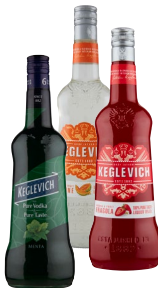
KEGLEVICH Vodka frutta assortita cl 70