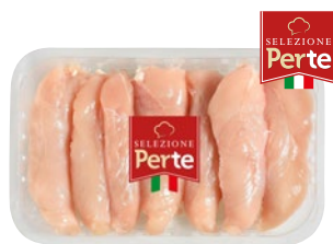
PERTE minifiletto di pollo g 400