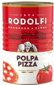
RODOLFI polpa pomodoro pizza kg 4,05