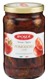
IPOSEA pomodori secchi in olio di girasole kg 1,6