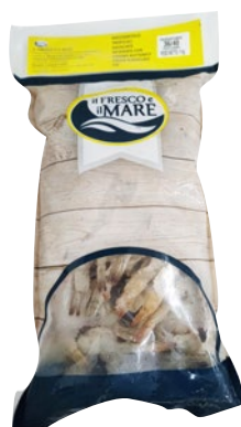
MAZZANCOLLA BUTTERFLY 36/40 Ecuador congelata kg 1