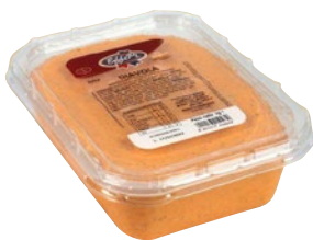
SNACK TIME salsa diavola fresca kg 1