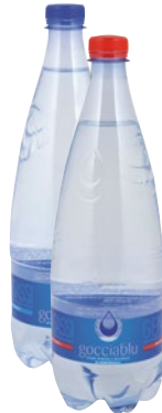
GOCCIA BLU acqua minerale frizzante, naturale litri 1