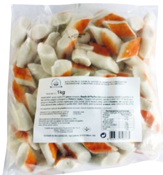
BOCCONCINI DI SURIMI sapore granchio IQF congelato kg 1