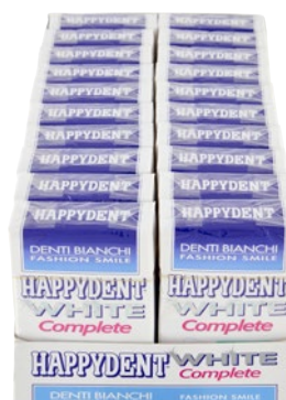
HAPPYDENT chewing gum White complete pz 20 x g 30