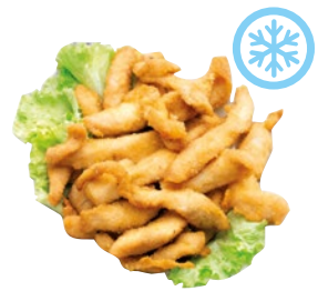
FILETTI DI POLLO PANATI congelati kg 1