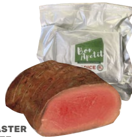
MASTER BEEF roastbeef sottofesa Radice al kg