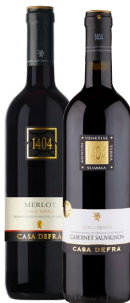
CASA DEFRA Vini Colli Berici, DOC Merlot, Cabernet Sauvignon cl 75