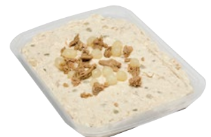
INSALATA CONTADINA kg 1 al kg