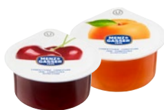
MENZ & GASSER confetture assortite pz 100 x g 25