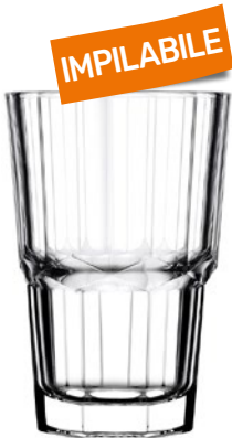
BICCHIERE SERENITY impilabile pz 12 - cad