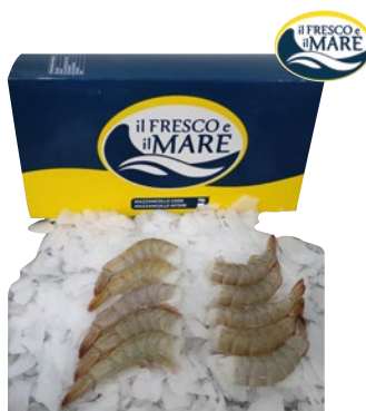
IL FRESCO E IL MARE code di mazzancolle Ecuador 26/30 congelate kg 2