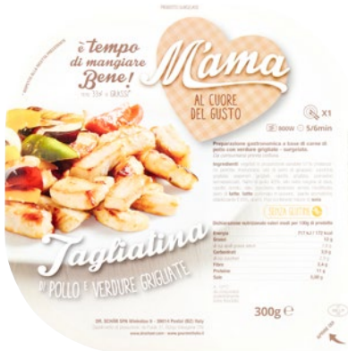
M'AMA tagliatina di pollo e verdure grigliate surgelato g 300