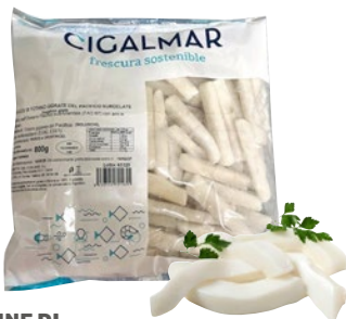
FETTUCCINE DI TOTANO IQF congelato g 800