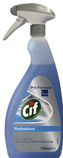
CIF detergente vetri specchi ml 750