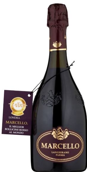
MARCELLO Spumante rosso dry cl 75