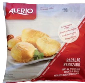
ALFRIO filetto di merluzzo nordico punta sale pastellato surgelato kg 1