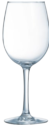
CALICE VINA pz 6 - cad