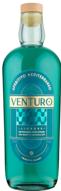
VENTURO Liquore Aperitivo Mediterraneo cl 70