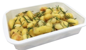
PATATE AL ROSMARINO kg 1 al kg