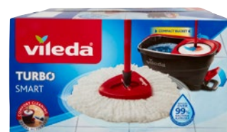
VILEDATA Turbo smart secchio/ manico/ mop pz 1