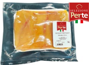
PERTE petto di pollo a fette sottovuoto al kg