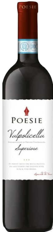
LE POESIE Valpolicella DOC superiore cl 75