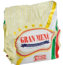
TRINITÀ prosciutto cotto Gran Menù 1/2 al kg