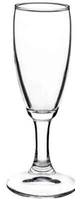
FLUTTINO CALYPSO cl 10 pz 6 - cad