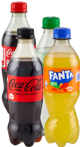
COCA COLA/ FANTA/ SPRITE bibite assortite cl 45