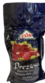
PINI bresaola Preziosa sottofesa 1/2 al kg