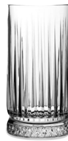
WHISKY CL 21 pz 4 - cad