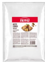
NOVA misto funghi trifolati kg 1,7