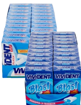
VIVIDENT XYLIT chewing gum Spearmint, Fresh Blast pz 20 x g 30