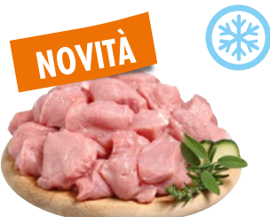
SPEZZATINO DI TACCHINO sottovuoto congelato al kg