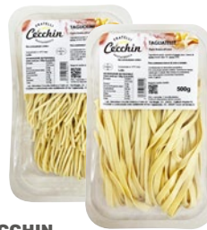
CECCHIN pasta liscia fresca all'uovo tagliolini, tagliatelle g 500