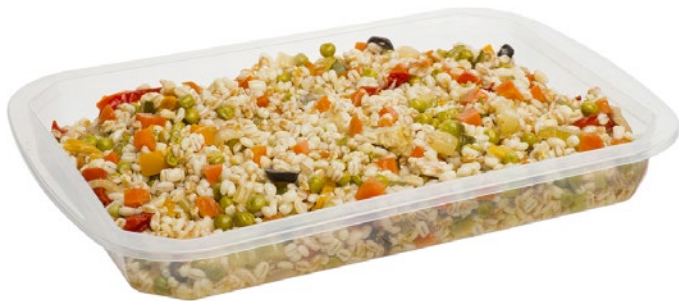
IL CEPPPO insalata d'orzo e farro mediterranea g 800 al kg