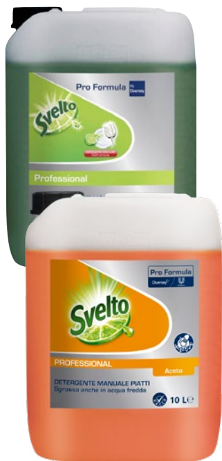
SVELTO detersivo liquido piatti limone, aceto litri 10