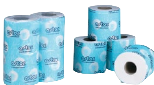
ASTOR carta igienica fascettata pz 4