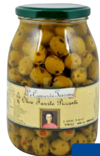
CONSERVE TOSCANE olive farcite piccanti g 970 sgocc g 600