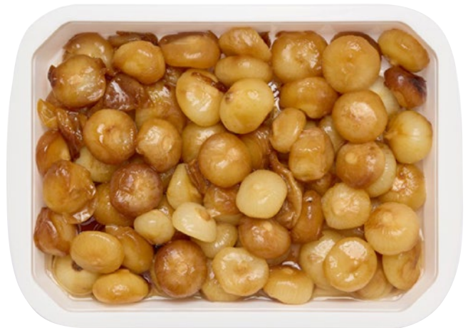
CIPOLLE AL FORNO kg 1 al kg