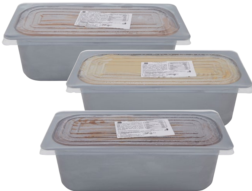
SÙ gelato vaschetta assortito kg 3