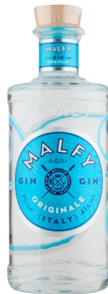
MALFY Gin Originale cl 70