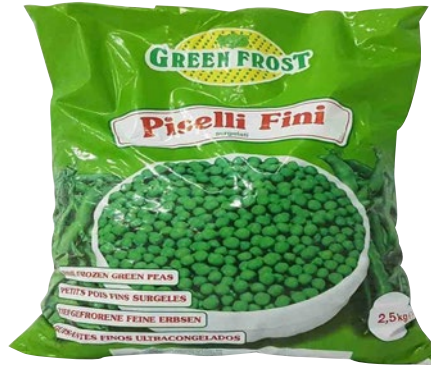
GREEN FROST piselli fini surgelati kg 2,5