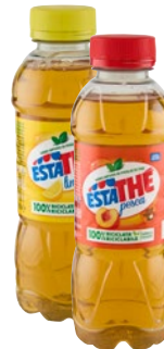
ESTATHÉ the limone, pesca cl 40