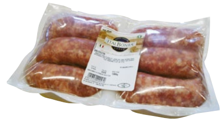
ITALBONTA' salsiccia suino bipack g 1080