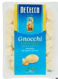
DE CECCO gnocchi di patate fresche g 500