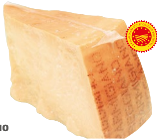
PARMIGIANO REGGIANO DOP 1\16 sottovuoto al kg