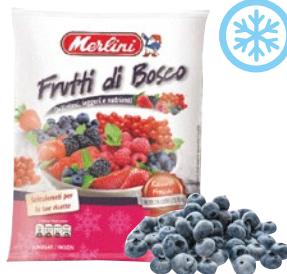
MERLINI mirtilli neri di bosco surgelati g 750