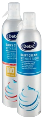
DEBIC panna montata con e senza zucchero Spray cl 70