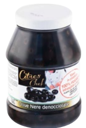
CITRES olive nere denocciolate in salamoia kg 2,3 sgocc kg 1,08