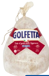
GOLFETTA il Golfetta al kg