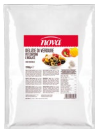
NOVA delizie di verdure in olio kg 1,7