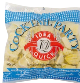
IDEA QUICK salatini cocktail party surgelati kg 1