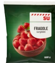
SÙ fragole surgelate kg 1