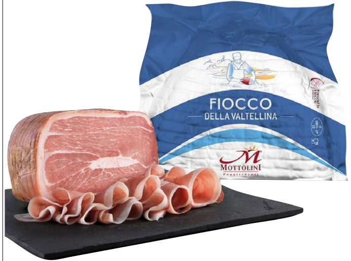
MOTTOLINI fiocco crudo della Valtellina al kg