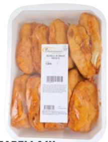
MOZZARELLA IN CARROZZA al prosciutto kg 1,3 al kg