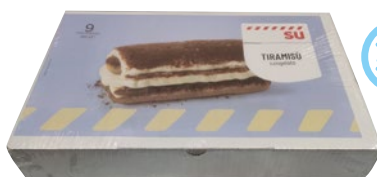
SÙ Tiramisu congelato 9 monoporzioni g 990