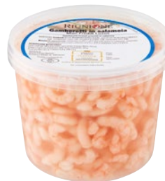
RIUNIONE gamberetti mari freddi 150/250 luxus g 450