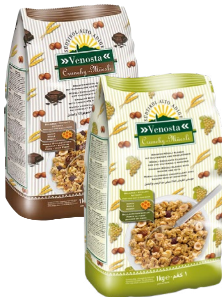
VENOSTA muesly crunchy ciocco/nocciole, classico kg 1