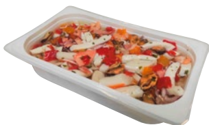
INSALATA DI MARE kg 1 al kg