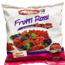
MERLINI frutti di bosco 5 gusti surgelati g 750