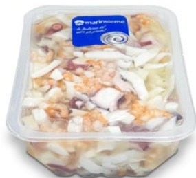
MARINSIEME antipasto Gran Mare kg 1,4