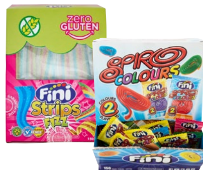
FINI gomme Tornado tutti frutti Fizz, Strips Fizz, Tubes inside out, Spiro Colours pz 150