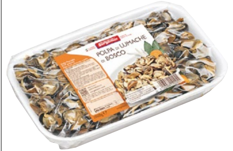
SURGENUIN polpa di lumache di bosco surgelata kg 1