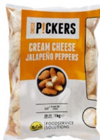
MCCAIN jalapeno con formaggio surgelato kg 1