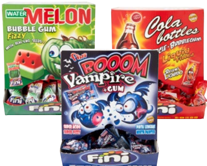
FINI bubble gum Watermelon, Cola, Vampire pz 200