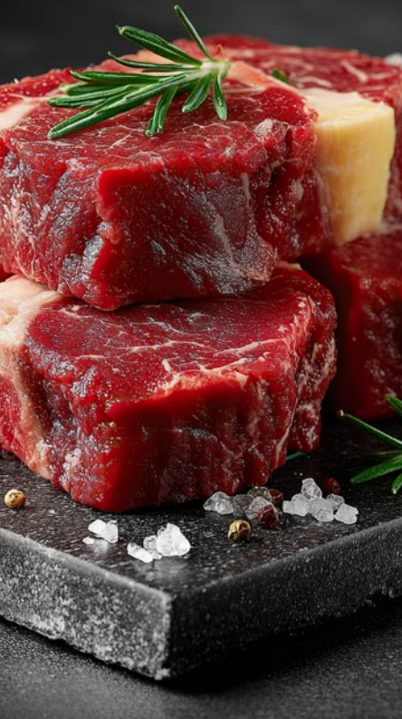
SCAMONE A CUORE bovino adulto Argentina sottovuoto al kg