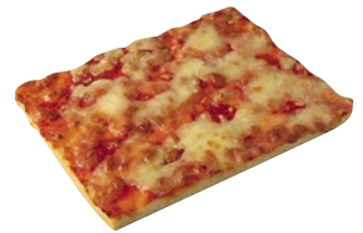
LANTERNA trancio pizza margherita surgelato g 580