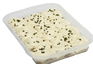
VITELLO TONNATO kg 1,4 al kg