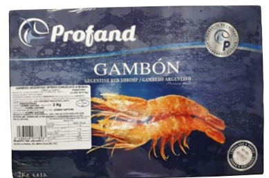
GAMBERO ARGENTINO INT.L1 congelato a bordo kg 2