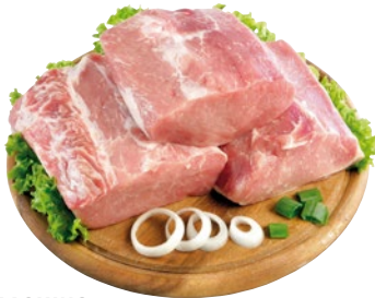
LONZA DI SUINO INTERA senza cordone sottovuoto al kg