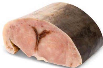
FILONE SPADA Spagna 2/4 kg c/pelle c/ osso sottovuoto congelato al kg

Il successo di ogni piatto inizia con la scelta degli ingredienti di qualità.