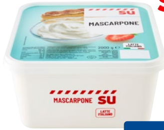
sù Mascarpone kg 2