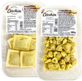
CECCHIN pasta fresca ripiena assortita g 500