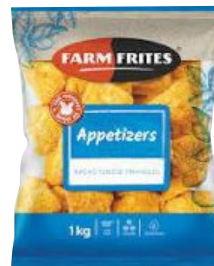
FARM FRITES nacho cheese triangoli ripieni surgelati kg 1