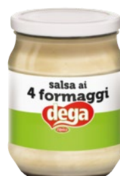
DEGA salsa ai 4 formaggi g 540