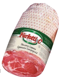
FURLOTTI pancetta coppata sgrassata Campagnola 1/2 al kg