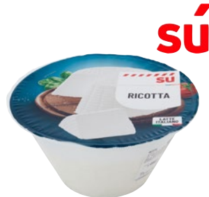
SÚ Rricotta vaccina kg 1,5