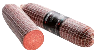
BRUGNOLO salame Milano, Ungherese 1/2 kg 1.5ca al kg