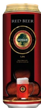
EICHBAUM birra rossa cl 50