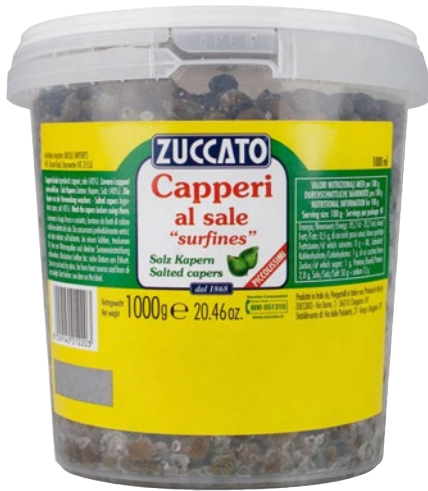
ZUCCATO capperi al sale piccolissimi kg 1