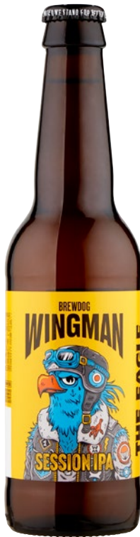
BREWDOG WINGMAN birra Session Ipa cl 33