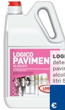
LOGICO detergente pavimenti alcolico litri 5