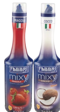
FABBRI sciropi Mixy Fruit assortiti litri 1