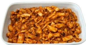
SEPIE IN UMIDO kg 1,2 al kg