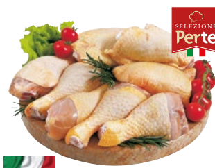
PERTE coscette di pollo sezionate confezione risparmio al kg