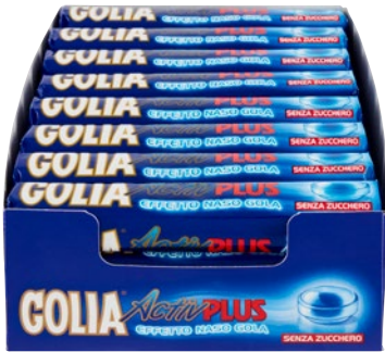
GOLIA caramella Activ plus pz 24 x g 34