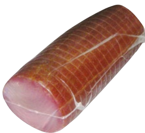
RIUNIONE tonno affumicato trancio kg 1,5 ca