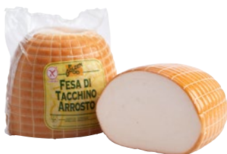
GOLDENFOOD fesa di tacchino arrosto al kg