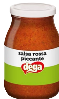
DEGA salsa rossa piccante kg 1