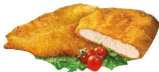
COTOLETTE DI POLLO PANATE congelate kg 3