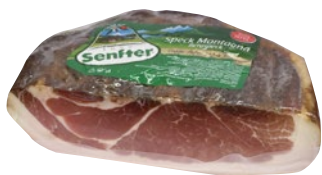
SENFTER speck di montagna al kg