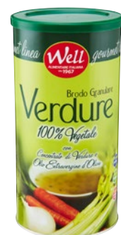
WELL brodo granulare verdure kg 1