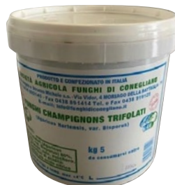
CONEGLIANO funghi Champignon trifolati kg 5