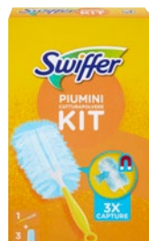
SWIFFER piumini catturapol. kit pz 1