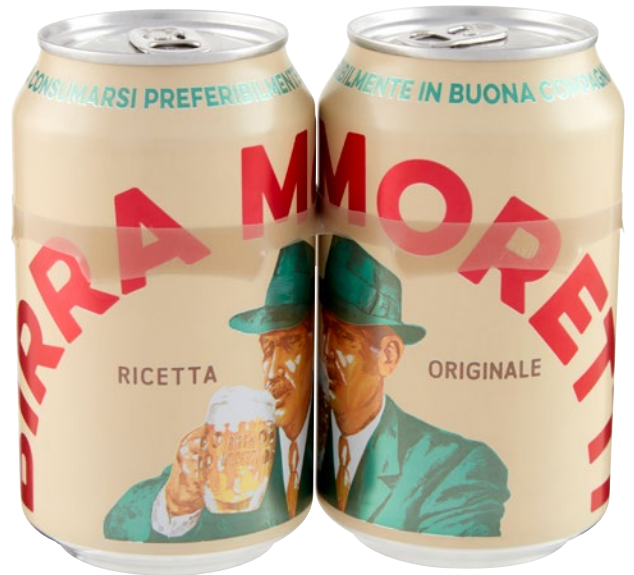
MORETTI birra pz 2 x cl 33