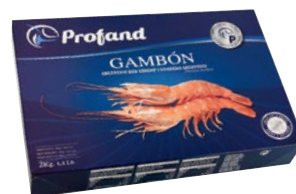
GAMBERO ARGENTINO intero I2 congelato bordo g 2000