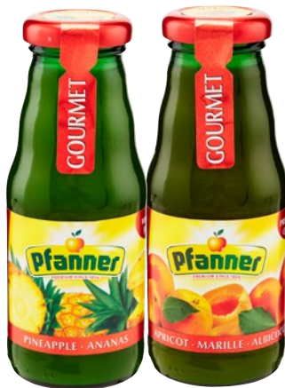
PFANNER bevanda, nettare, succo assortiti cl 20