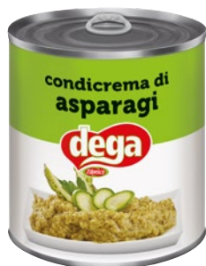
DEGA condicrema asparagi g 800