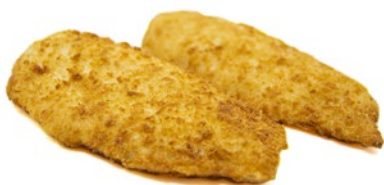
FILETTO DI NASELLO panato prefritto congelato g 600