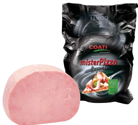
COATI prosciutto cotto Mister Pizza al kg