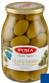
IPOSEA olive verdi Bella di Cerignola in salamoia g 950 sgocc g 630