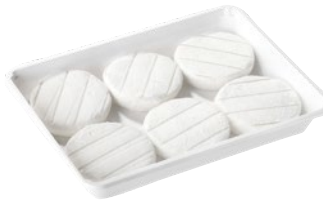
FIOR DI MASO tomino classico al kg