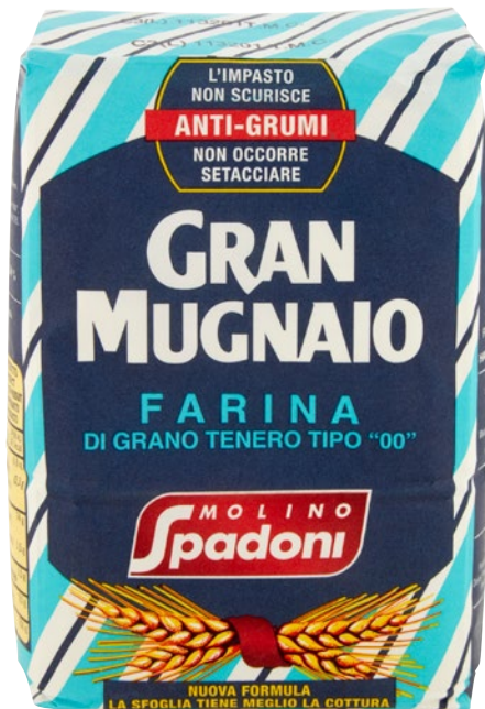
MOLINO SPADONI farina Antigrumi migliorata per pasta kg 1