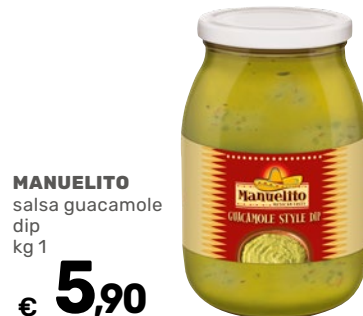
MANUELITO salsa guacamole dip kg 1