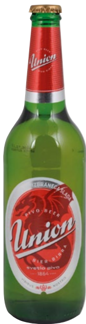
UNION birra cl 66