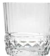
CALICE AMERICA' 20S pz 6 - cad