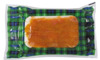
RIUNIONE ritagli salmone Scozzese affumicato g 250