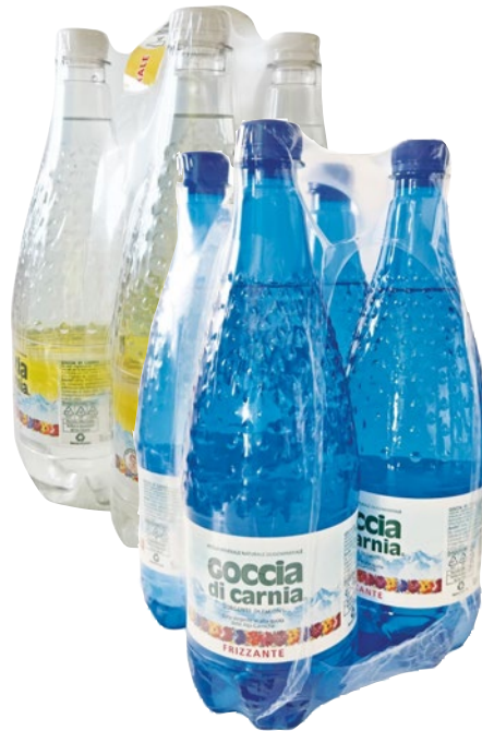
GOCCIA DI CARNIA acqua minerale naturale, frizzante bott 4 x litri 1