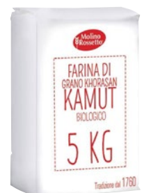
MOLINO ROSSETTO farina di kamut bio kg 5