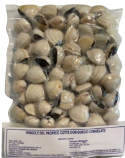
VONGOLA PACIFICO 60/90 cotta c/guscio congelato kg 1