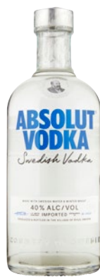
ABSOLUT Vodka bianca cl 70