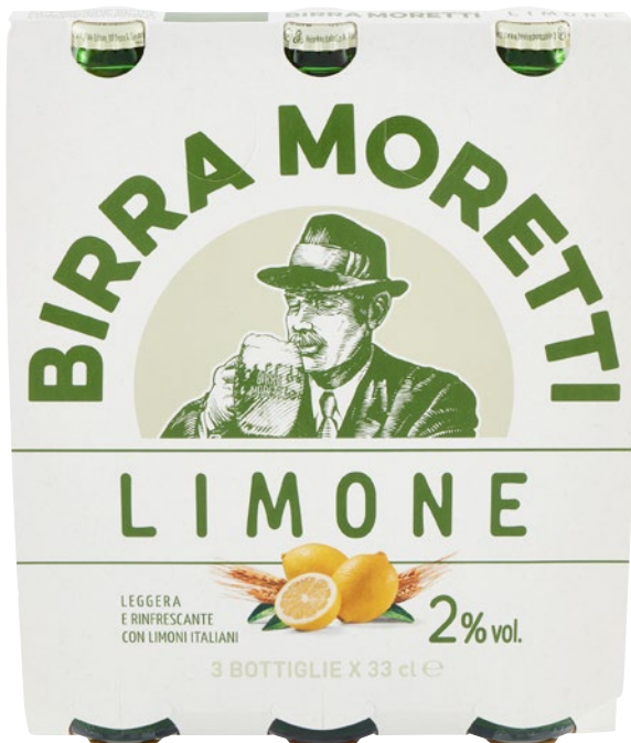
MORETTI Radler limone bott 3 x cl 33