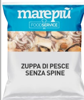
MARE PIÙ zuppa di pesce s/spine congelato g 800