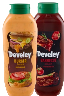
DEVELEY salsa barbecue, hamburger ml 875