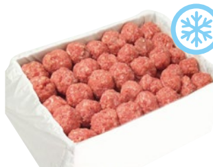
POLPETTE BOVINO adulto senza glutine congelato kg 1 al kg