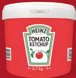
Heinz Tomato Ketchup Secchio 5.7 Kg