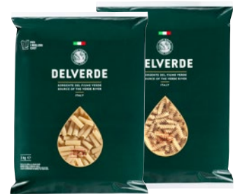
DELVERDE pasta di semola assortita kg 3