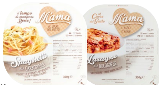
M'AMA spaghetti alla Carbonara lasagne alla Bolognese surgelato g 350