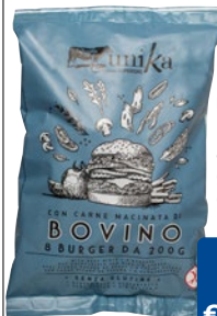
UNIKA burger di bovino adulto senza glutine congelati pz 8 x g 200