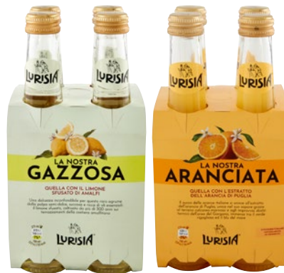
LURISIA bibite assortite bott 4 x cl 27,5