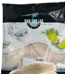
FILETTO DI PLATESSA pacifico n.3 c/pelle surgelato g 750