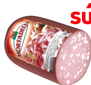
SÙ mortadella kg 2 ca al kg