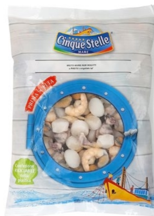
CINQUE STELLE misto mare x risotti e pasta congelato g 750