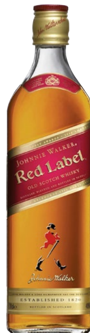
JOHNNIE WALKER Red Label Whisky cl 70