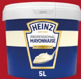
Heinz Mayo Professional Secchio 4,8 Kg