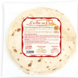
ARTE DELLA PIADA piadina strutto IGP fresca pz 5 - g 600