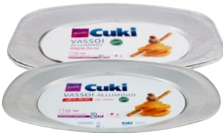
CUKI PRESENTA vassoi alluminio doppia forza 6/8 porzioni pz 3/2