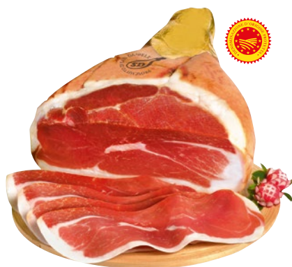
SAPER DI SAPORI prosciutto di San Daniele DOP 18 mesi al kg