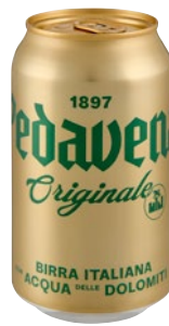
PEDAVERA birra cl 33