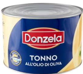
DONZELA tonno yellowfin all'olio di oliva kg 1,63