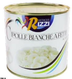
RIZZI cipolle bianche a fette al naturale kg 2,5 sgocc kg 1,5