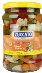
ZUCCATO La Giardiniera kg 1,55 sgocc kg 1,05