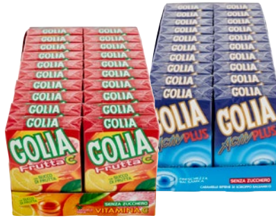
GOLIA caramelle Activ plus, Frutta pz 20 x g 46