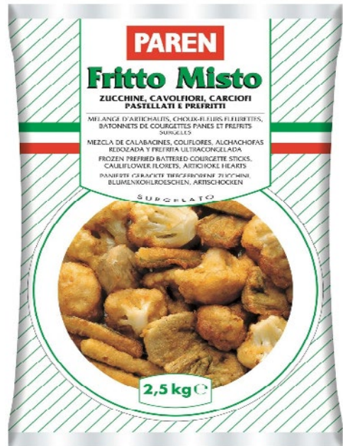
PAREN fritto misto pastellato surgelato kg 2,5