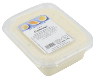
SNACK TIME salsa asparagi e uova fresca kg 1