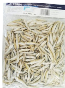
LATTERINI congelato kg 1