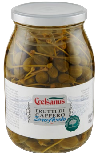
COELSANUS frutti di cappero zero-aceto kg 1 sgocc g 480