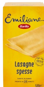
EMILIANE lasagne gialle spesse g 500