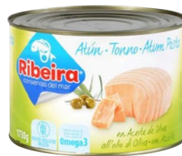
RIBEIRA tonno all'olio di oliva kg 1,73