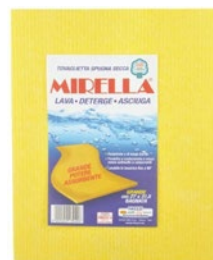
MIRELLA panno spugna gialla grande pz 1 cm 27x31,5