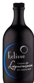
ECLISSE Liquore alla liquirizia di Calabria DOP cl 50