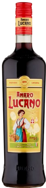
AMARO LUCANO Amaro litri 1