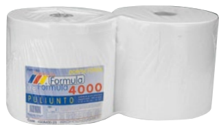
FORMULA carta Puliunto kg 4 - pz 2