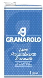
GRANAROLO latte UHT parzialmente scremato litri 1