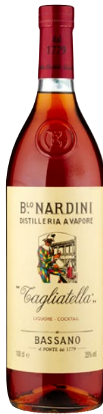
NARDINI Tagliatella litri 1