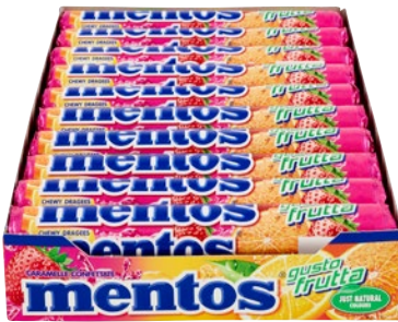
MENTOS caramelle confettate frutta pz 20 x g 38