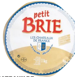
CHATEAUX DE FRANCE Petit Brie kg 1 al kg