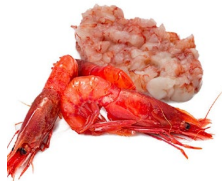
TARTARE GAMBERO ROSSO bordo top quality congelato pz 4 x g 80