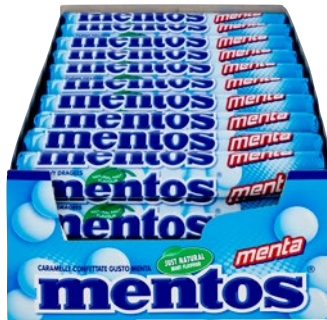
MENTOS caramelle confettate menta pz 40 x g 30