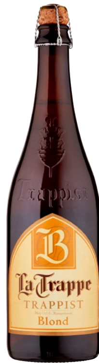
LA TRAPPE birra Trappist Blond cl 75