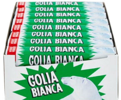
GOLIA caramelle menta bianca pz 24 x g 38