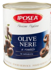
IPOSEA olive nere a rondelle in salamoia kg 3 sgocc kg 1,56