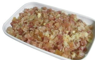
NERVETTI CON CIPOLLA kg 2 al kg