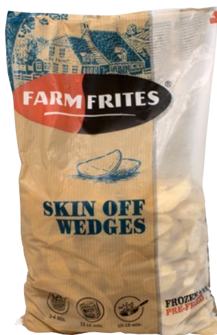
FARM FRITES patate spicchi surgelate kg 2,5