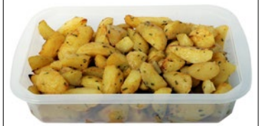
PATATE A SPICCHI AL FORNO kg 1,95 al kg