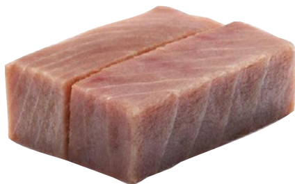
SAKU TONNO pinnegiale-Frime congelato al kg