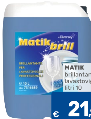
MATIK brillantante lavastoviglie litri 10