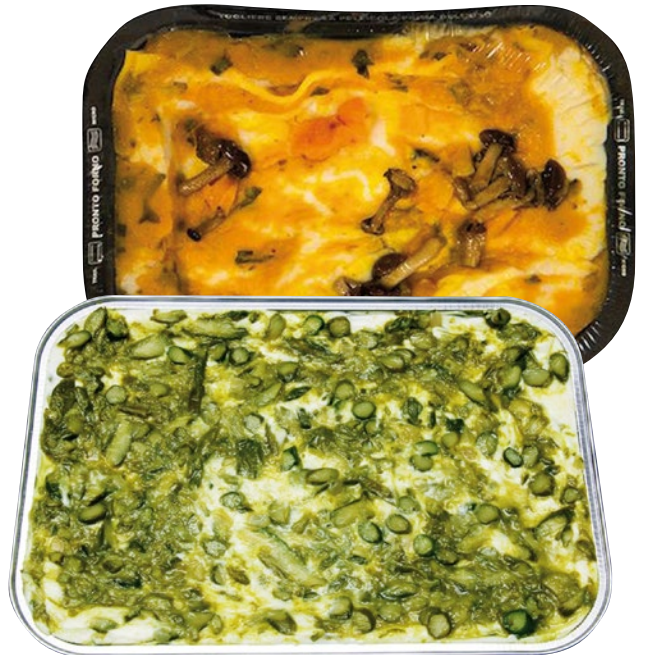
LASAGNE zucca e funghi, asparagi kg 3 al kg