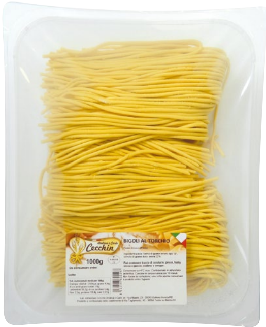
CECCHIN bigoli al torchio freschi kg 1