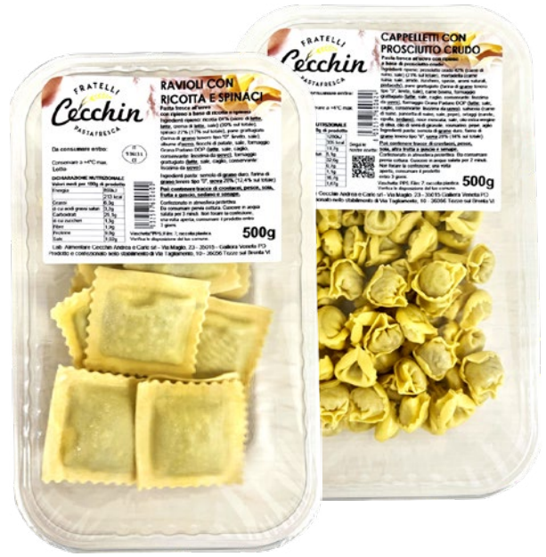
CECCHIN pasta fresca ripiena assortita g 500