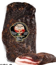
BRUGNOLO guanciale squadrato senza cotenna kg 2 ca al kg