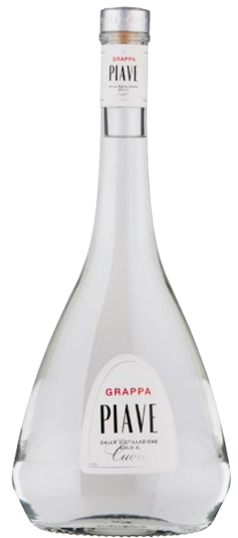
PIAVE Grappa 40' Cuore cl 70