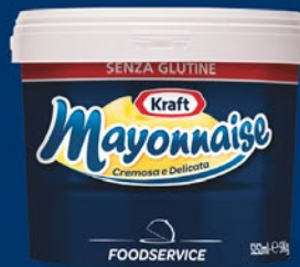
Kraft Mayonnaise Secchio 5 Kg