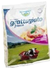
BAYERNLAND grattugiato fresco kg 1