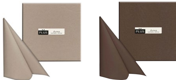
TOVAGLIA COPRIMACCHIA cacao cm 100x100 pz 25