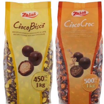
ZAINI Ciococroc cereali, Ciocobiscò kg 1