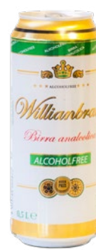
WILLIANBRAU birra analcolica cl 50