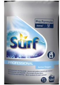
SURF detersivo lavatrice polvere 120 misurini kg 9,60