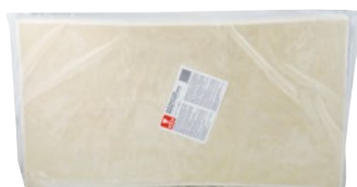
KOCH pasta sfoglia stesa surgelato kg 2,5