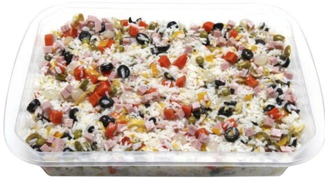
INSALATA DI RISO kg 1 al kg