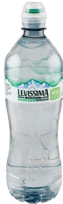
LEVISSIMA acqua minerale naturale cl 75