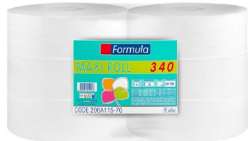
FORMULA carta igienica Maxi roll 340 pz 6