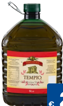
TEMPIO olio extra verGINE di oliva litri 5