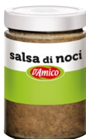
D'AMICO salsa di noci g 500