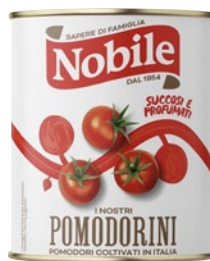
NOBILE pomodorini kg 2,55 sgoccioli kg 1,53