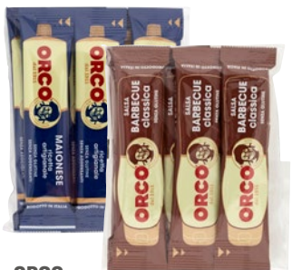
ORCO maionese, ketchup, senape, salsa barbecue monodose pz 6 x ml 15