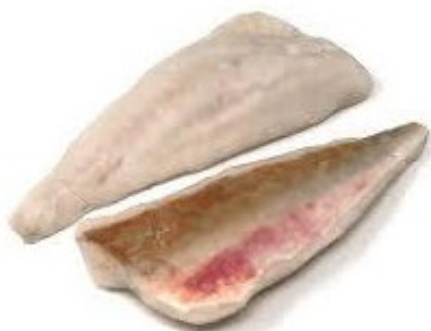
FILETTO DI SPIGOLA Pacifico c/pelle 120/170 congelato kg 4,5