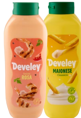
DEVELEY salse maionese, rosa ml 875