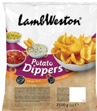
LAMB WESTON potato dippers surgelate kg 2,5