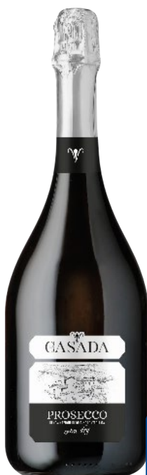
LA CASADA Prosecco extra dry doc cl 75