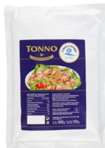
L'ISOLA D'ORO tonno in olio di oliva kg 1