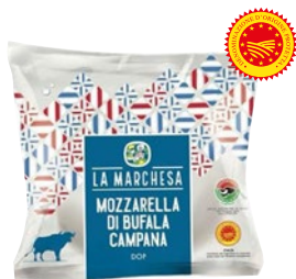
LA MARCHESA mozzarella di bufala Campana DOP g 125