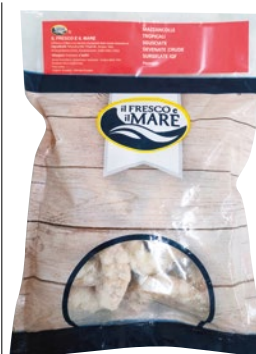
IL FRESCO E IL MARE mazzancolle s/g. devenate Ecuador 31/35 congelato g 750