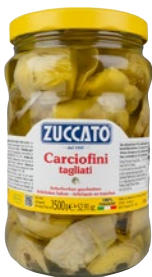
ZUCCATO carciofini tagliati in olio di girasole kg 1,5