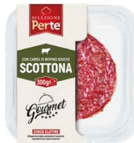
PERTE burger scottona bovino adulto senza glutine g 300