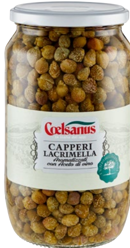
COELSANUS capperi Lacrimella aromatizzati con aceto di vino g 700 sgocc g 420