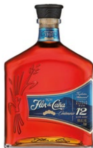
FLOR DE CANA Ron 12 years cl 70