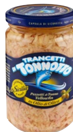
TONNOTTO trancetti di tonno yellowfin in olio di oliva g 300