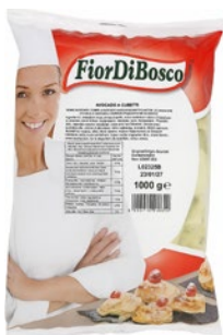
FIORDIBOSCO avocado a cubetti congelato kg 1