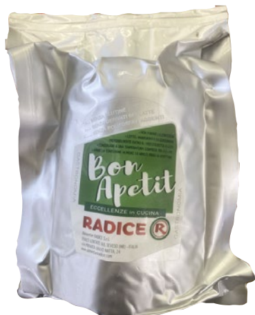
BON APETIT RadiceE lonza per tonnato al kg