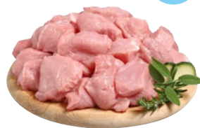
SPEZZATINO TACCHINO congelato sottovuoto al kg