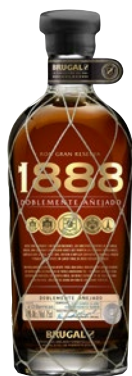
BRUGAL Ron Gran Reserva 1888 Doblemente Anejado cl 70