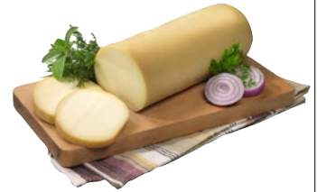
SABELLI Provola affumicata filone al kg