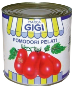
GIGI pomodori pelati alta resa kg 2,5 sgoccioli kg 1