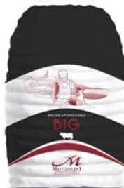
MOTTOLINI bresaola punta d'anca Big al kg