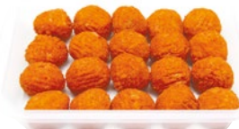
ARANCINI DI RISO kg 1 al kg