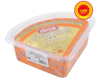
IGOR Gorgonzola DOP 1/8 al kg