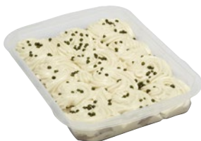
VITELLO TONNATO kg 1,4 al kg