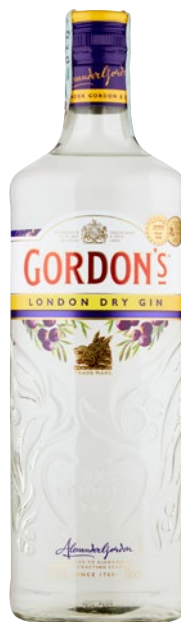
GORDON'S Gin cl 70