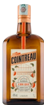
COINTREAU l'Unique Liqueur litri 1