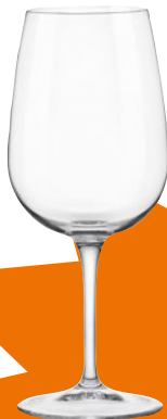
CALICE SPAZIO cl 50 pz 6 - cad