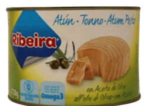
RIBEIRA tonno pinne Gialle all'olio di oliva kg 1,73