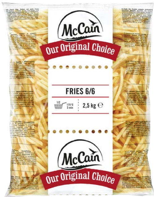
MC CAIN patate Julienne 6/6 surgelate kg 2,5