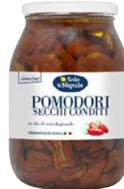
'O SOLE'E NAPULE pomodori secchi in olio di girasole g 960