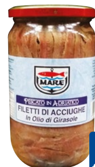
MARE filetti di acciughe distese in olio di girasole g 720