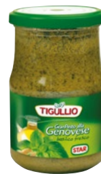
TIGULLIO pesto genovese g 500