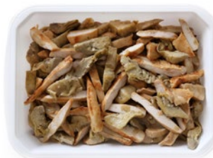
TAGLIATA DI PETTO DI POLLO AI CARCIOFI kg 1,5 al kg