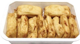
MOZZARELLA IN CARROZZA con acciuga al kg