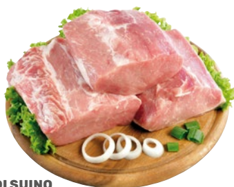
LONZA DI SUINO INTERA senza cordone sottovuoto al kg