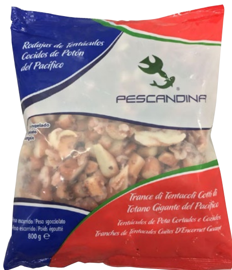
TENTACOLI DI TOTANO tagliati cotti surgelato g 800