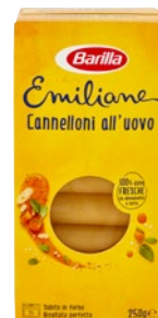
EMILIANE cannelloni g 250