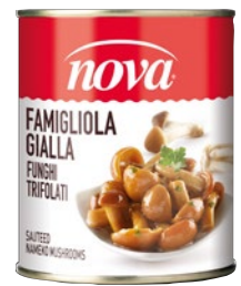
NOVA funghi Famigliola Gialla trifolati g 780