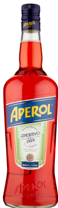
APEROL aperitivo litri 1