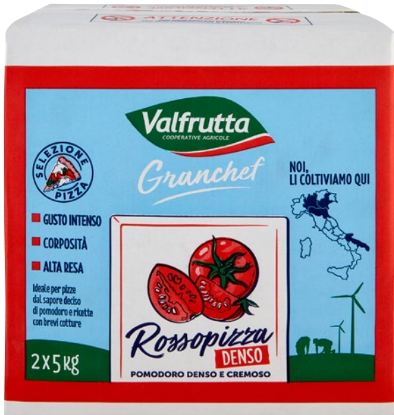
VALFRUTTA polpa rosso pizza pz 2 x kg 5