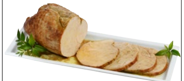
ROTOLO DI TACCHINO kg 1,5 al kg