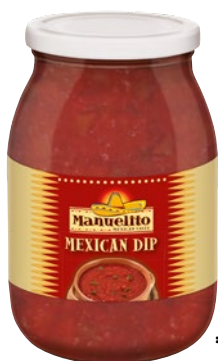
MANUELITO salsa messicana kg 1,05