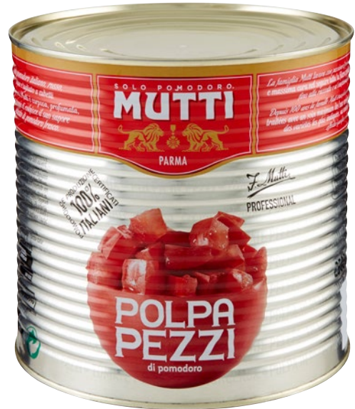
MUTTI polpa pomodoro a pezzi kg 2,5