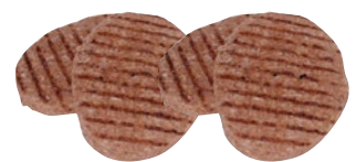
GE hamburger bovino cotto congelato pz 13 x g 83