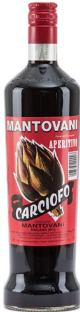
MANTOVANI Aperitivo al carciofo litri 1