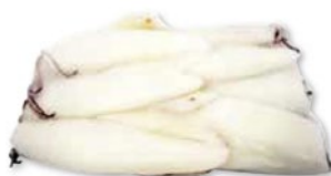
CALAMARO PACIFICO intero pulito u10 congelato kg 1,4