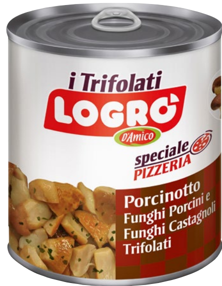
LOGRO Porcinotto trifolato g 780 sgocc g 550