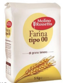
MOLINO ROSSETTO farina "00" grano tenero kg 5