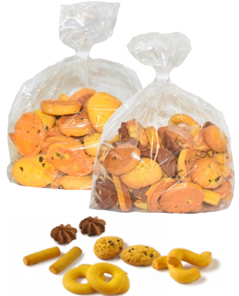
CARMELENA biscotti esse mignon, zaletti uvetta, assortiti kg 1