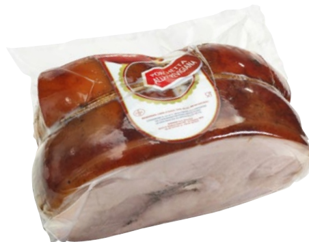
BONAZZA cosciotto porchetta trevigiana al kg