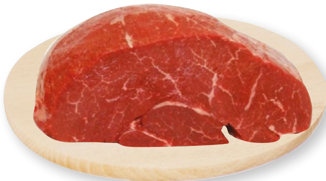
SCAMONE BOVINO ADULTO IRLANDA SOTTOVUOTO al kg