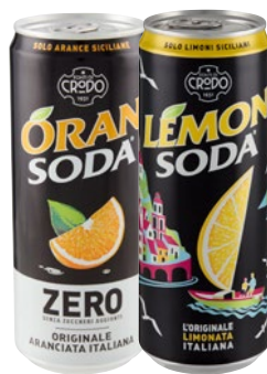
LEMONSODA/ ORANSODA bibite assortite cl 33