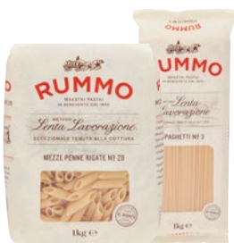
RUMMO pasta di semola a lenta lavorazione kg 1