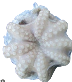
POLPO MAROCCO T6 arricciato fiore iwp surgelato al kg