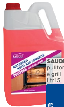
SAUDET pulitore forni e grill litri 5