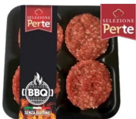
PERTE BBQ hamburger di suino senza glutine pz 4 x g 100