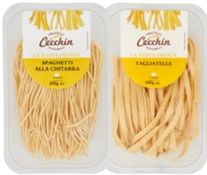
CECCHIN La pasta fresca bigoli, tagliatelle, spaghetti alla chitarra g 300