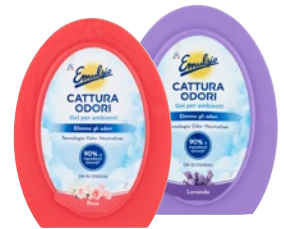
EMULSION cattura odori gel per ambienti lavanda, rosa g 150