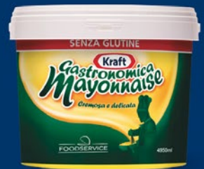
Kraft Mayonnaise Gastronomica Secchio 5 Kg