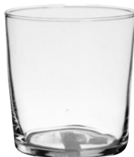
BICCHIERE BODEGA pz 36 - cad