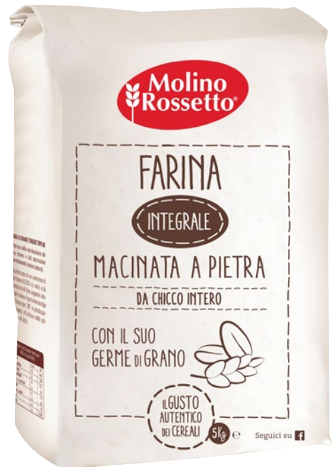
MOLINO ROSSETTO farina integrale macinata a pietra kg 5