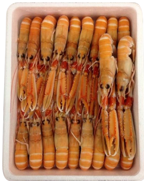
SCAMPI POLY 21/25 irlanda cong.azoto -60° kg 1,35