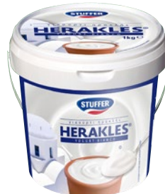
STUFFER HERAKLES yogurt bianco kg 1