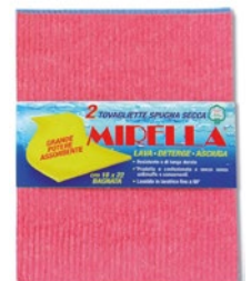
MIRELLA panno spugna rosa pz 1 cm 18x22