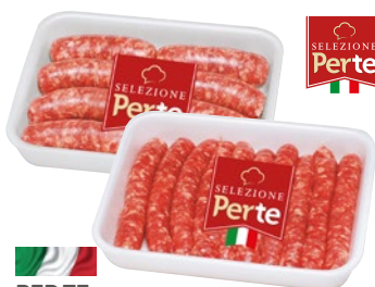
PERTE salsiccia di suino luganega, verzino confezione risparmio g 600