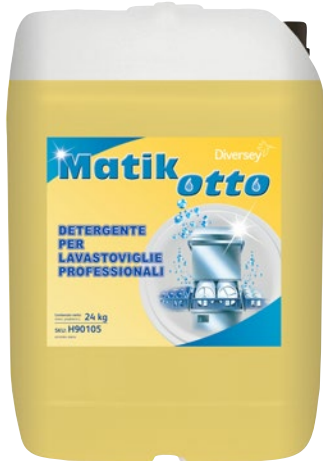
MATIK OTTO detergente per lavastoviglie kg 24