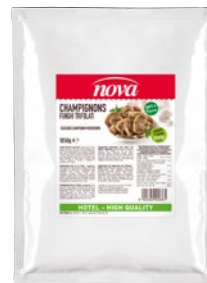
NOVA funghi Champignon trifolati kg 1,85