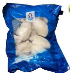
IL FRESCO E IL MARE seppia pulita 80/150lav. Italia congelato g 900