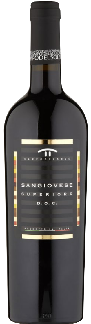
CAMPO DEL SOLE Sangiovese Superiore Romagna DOP cl 75