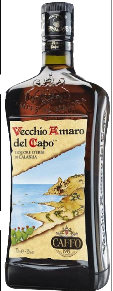
CAFFO Vecchio Amaro Del Capo cl 70