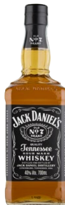
JACK DANIEL'S Old No. 7 Brand cl 70