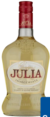
JULIA Grappa Invecchiata cl 70