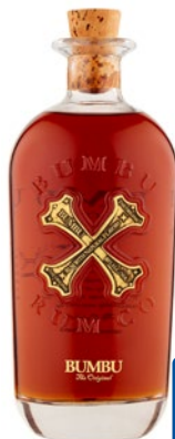
BUMBU The Original Rum cl 70