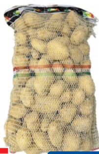
PATATE SACCO kg 10