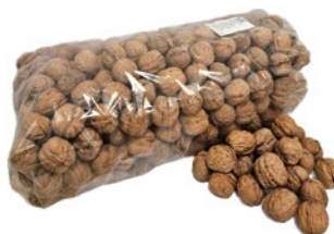
NOCI SACCO kg 5