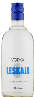
LESKAJA Vodka bianca cl 70