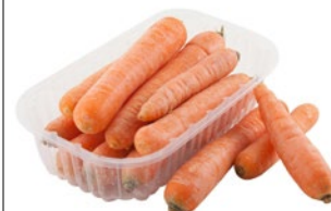
CAROTE VASSOIO kg 1