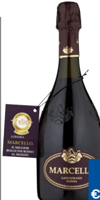
MARCELLO Lambrusco dell'Emilia IGP cl 75