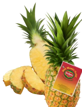
DEL MONTE Ananas al kg