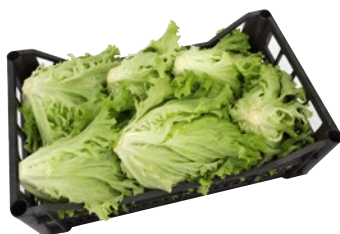
LATTUGA GENTILINA al kg