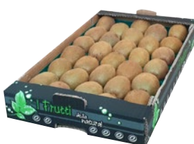
KIWI al kg