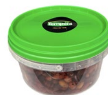
LECCINO Olive Denocciolate kg 1,8