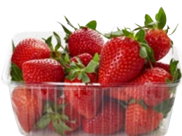
FRAGOLE CESTINO g 500